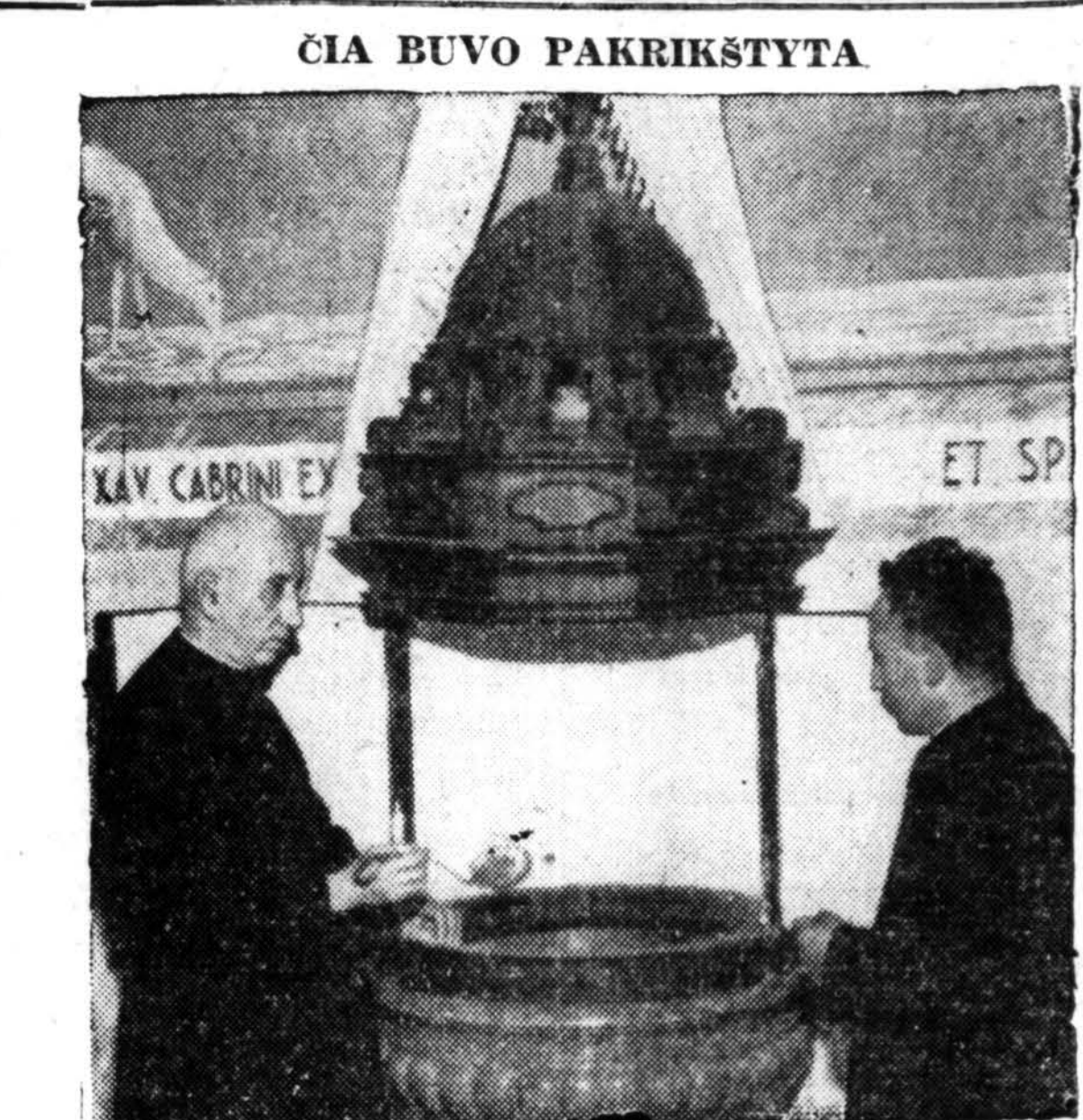
Krikštinyčia San Angelo bažnyčioj, Lodigiano, šiaurinėj Italijoje, buvo pakrikštyta šventoji Frances Cabrini.

paguldo, kad kiekvienas žmogus su pasipiktinimu žiūrėtų į jį. Jų šeimos naikamos, kad nepalikėtų savo raugo. Jie kovoja už Lietuvos laisvę, bet Tarybų valdžia sako, kad Lietuva laisva ir jai reikia tik darbo, o ji jau išvaduota nuo fašistų ir buožių".