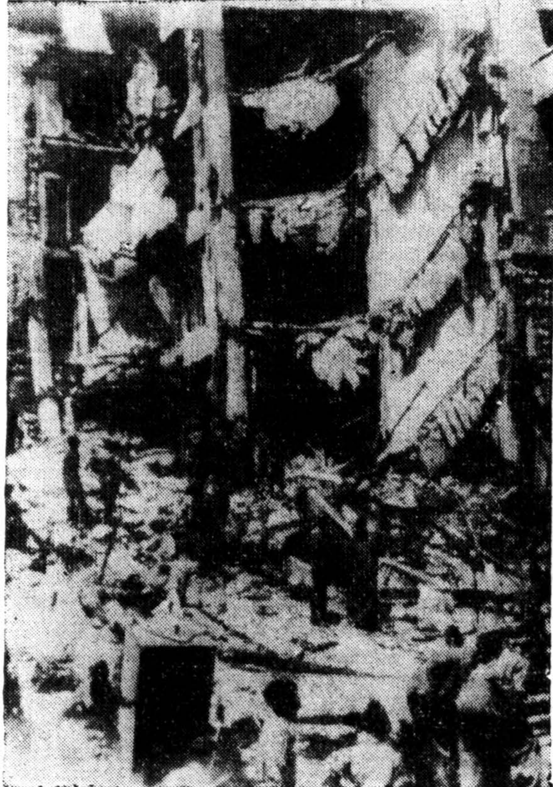
Radiofoto dalinai sugriauto King David viešbučio Jeruzalėje padaro kai kuriuos nuostolius, kuriuos padarė minų sproginimas, užmušęs 48 asmenis. Suvirš 50 asmenų dar nesurasta ir apie 72 buvo sužeista. Šioje viešbučio dalyje buvo britų militarinis štabas ir valdžios būstinė. Žydai teroristai kaltinami už tragediją.