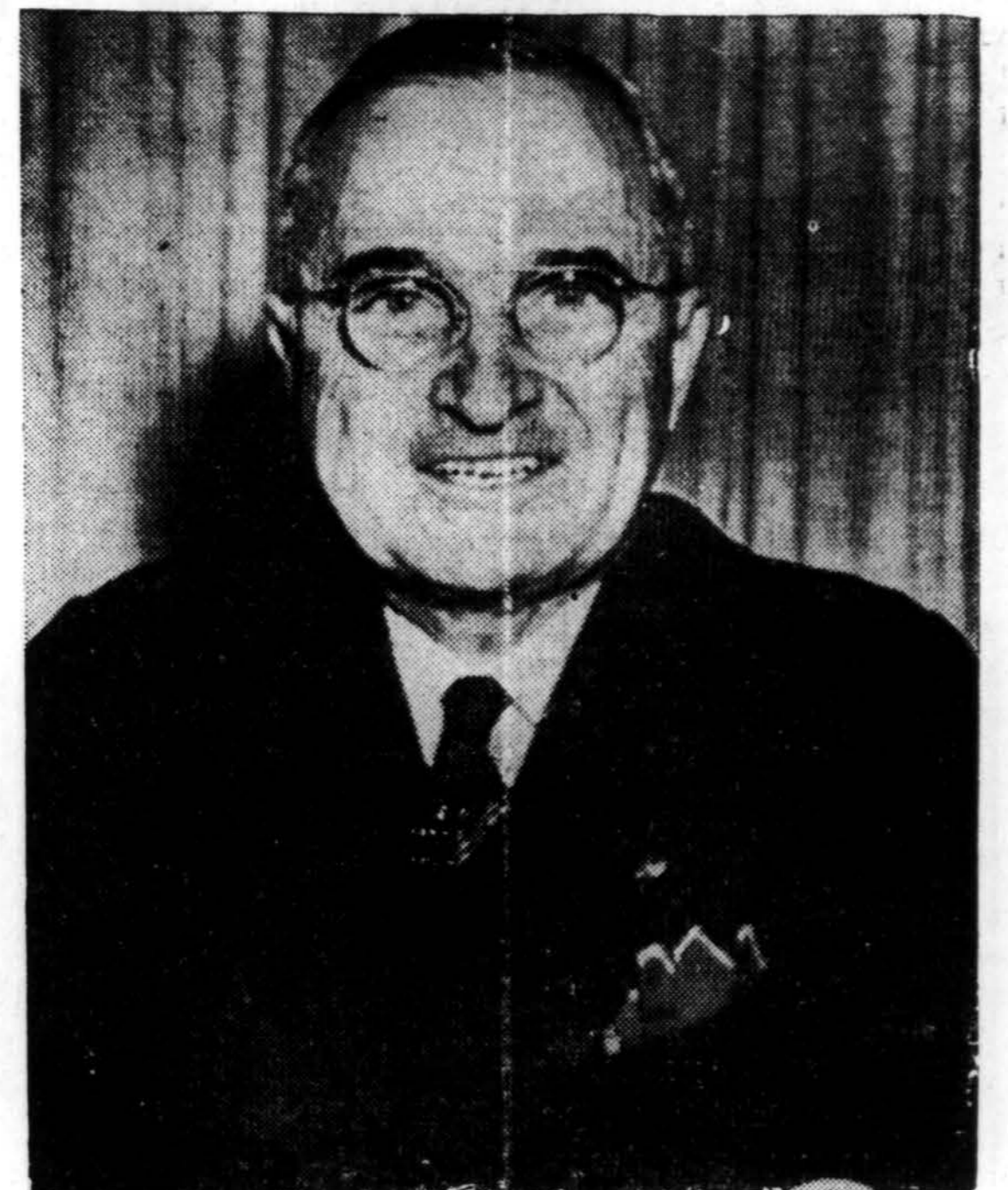
J.E. HARRY S. TRUMAN J.A. VALSTYBIŲ PREZIDENTAS