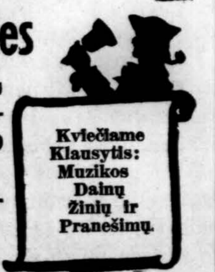
Kviečiame Klausyti: Muzikos Dalų Žinių ir Pranešimų.