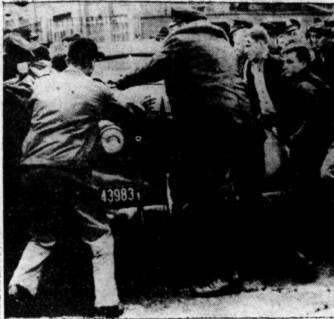
Šia nuotrauka užfiksuota muštynės ištikusios tarpe streikuojančių ir streiklausių Allis-Chalmers Manufacturing Co., darbininkų prie dirbtuvės vartų, Milwaukee, Wis. Policija deda pastangų mušeikas išskirstyti.

Berlin. — Ūkininkai, gyvenantieji pietus nuo Berlyno, praneša, kad praėjusią savaitę rusai išslavė visą apylinkę nuo paršų. Iš viso buvo atimta 700 paršų. Surinktus paršus rusų kareiviai nusigabeno į barakus ir sušveitė.