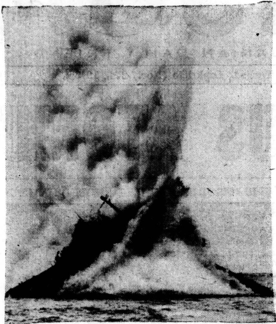
Amerikoj pagaminta ir ant vieno vokieciu submarino išbandyta nauja torpėda, kurios jėgā galima spręsti iš šios nuotraukos. Submarinas išneštas į orā.

daug pasiūtesni ir dar labiau nemėgsta užsienieciū, kaip Hitlerio laikais.