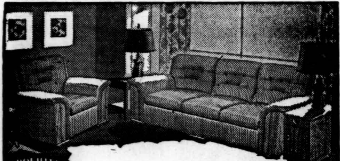
Šis Gražus Parlor Setas, $148.50 Lempa ir Stalėlis, už...

RAKANDAI, RADIOS, PEČIAI, GERIAUSIŲ ISDIRBYSČIŲ PARLOR SETAI, EUREKA, HOOVER, GENERAL ELECTRIC DULKIŲ VALYTOVAI TUOJ PRISTOMI JUMS!