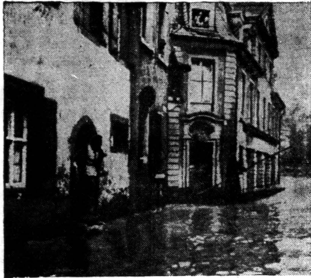
Dėl potvynio išsiliejęs Neckar upė, Vokietijoje, užliejo visą apylinkę, inimant ir Heidelberg miestą.

lijono lenkų buvo ištremti iš tėvynės, dešimtys tūkstančių nužudyti, o likusieji nugrūsti į laukinį Sibirą, kur didelė jų dalis baudžiavo jau žuvo.