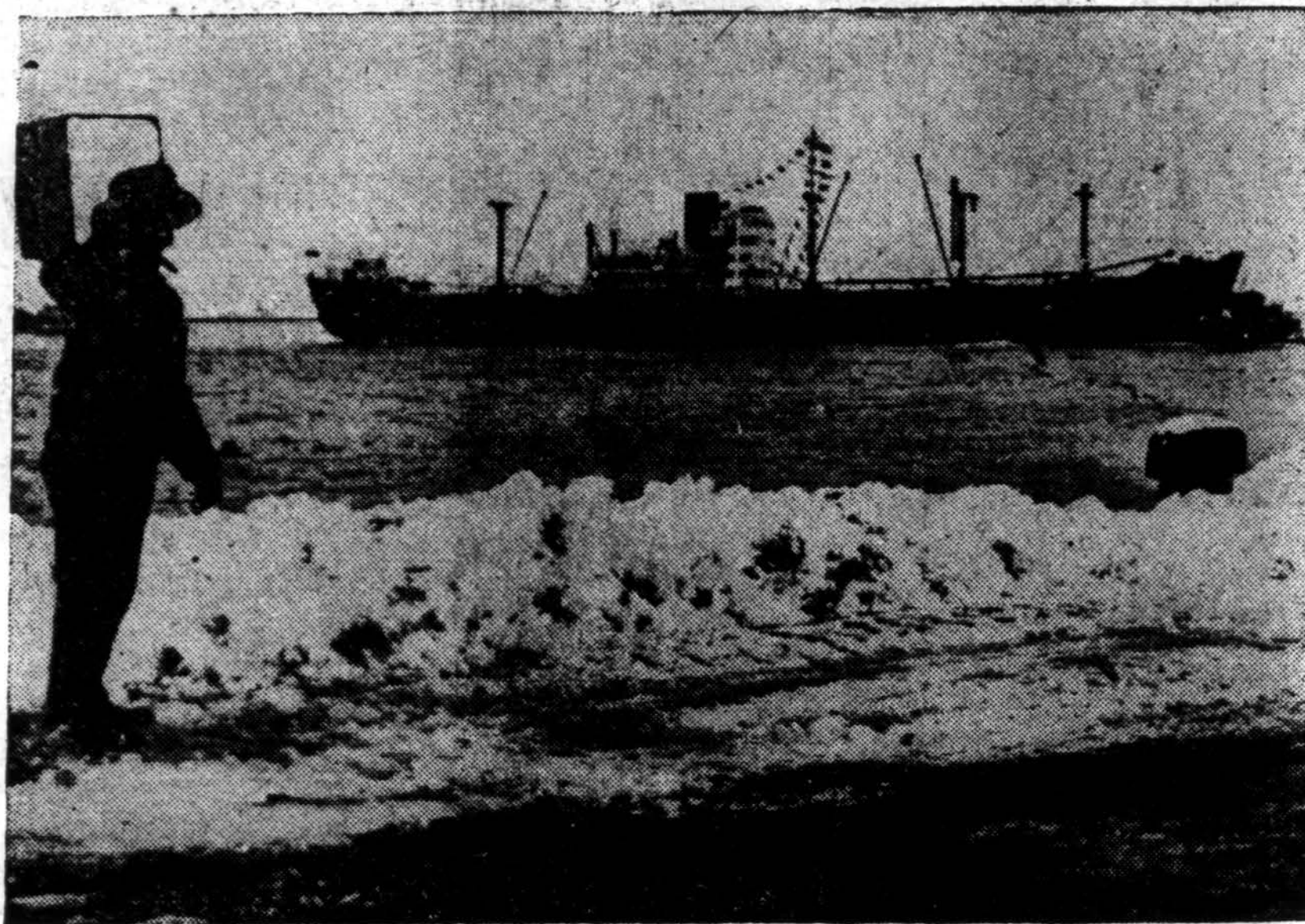
Bostono Chamber of Commerce pastangomis už $1,200,000 nupirkta maisto Skotijos badaujančiams. Vienas uosto darbininkas dar norėjo įteikti savo auką, tačiau laivas jau buvo gerokai atsitolinęs nuo uosto.