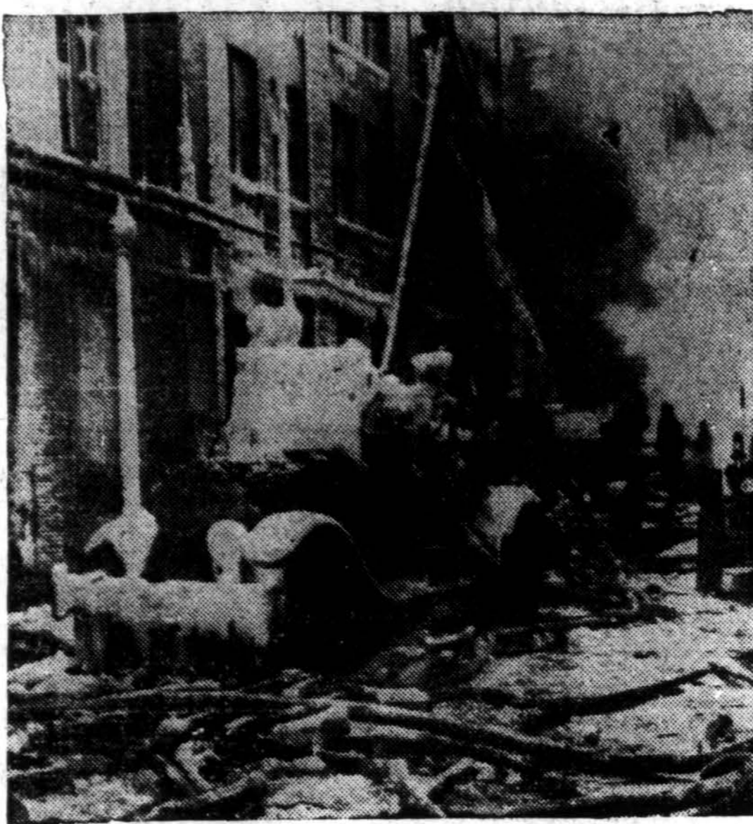
Bostone, Mass., šiomis dienomis kilo gaisras odų sandėlyje. Siaučiant šalčiui, kova ugniagesių su gaisru, kaip matome iš nuotraukos, buvo sunki. Gaisras gesintas ištisą naktį.