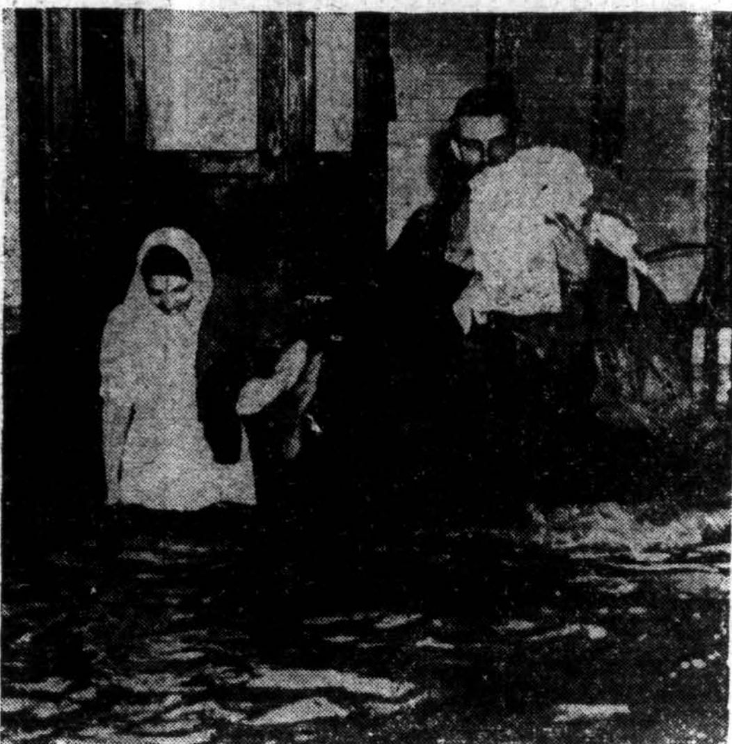
Su artėjantiu pavasariu jau prasideda Amerikoje potvyniai. Ši nuotrauka iš Knoxville, Tenn.