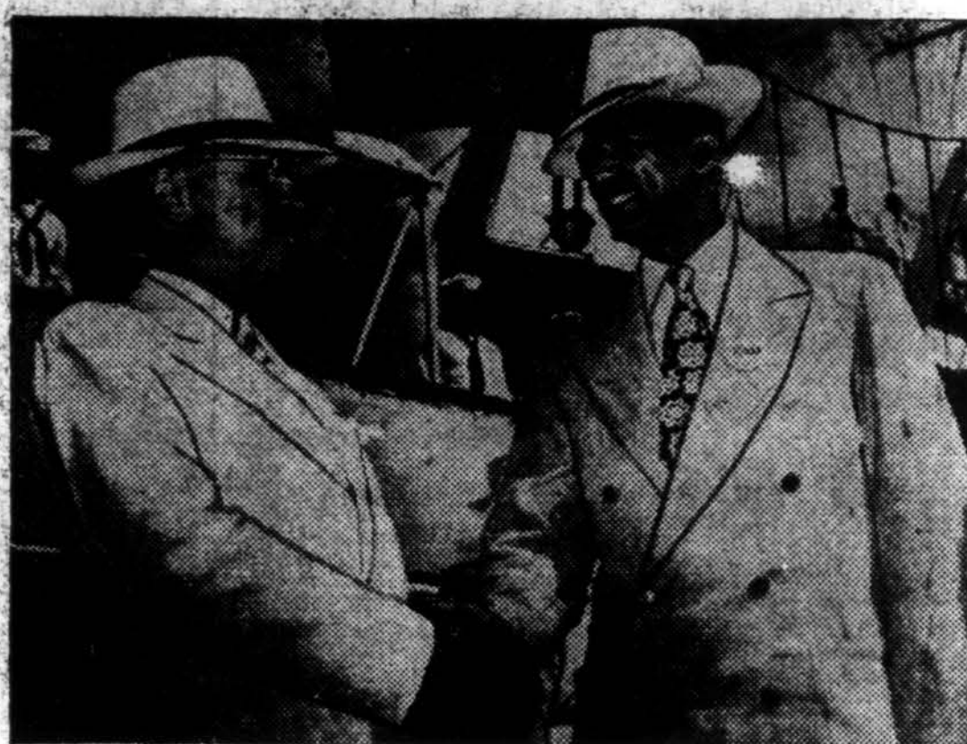
Virgin Island gubernatorius William Hastie sveikina Prez. Harry S. Truman, kuomet jis navyko ten. Prezidentas praleidžia trumpas atostogas Karibėje.