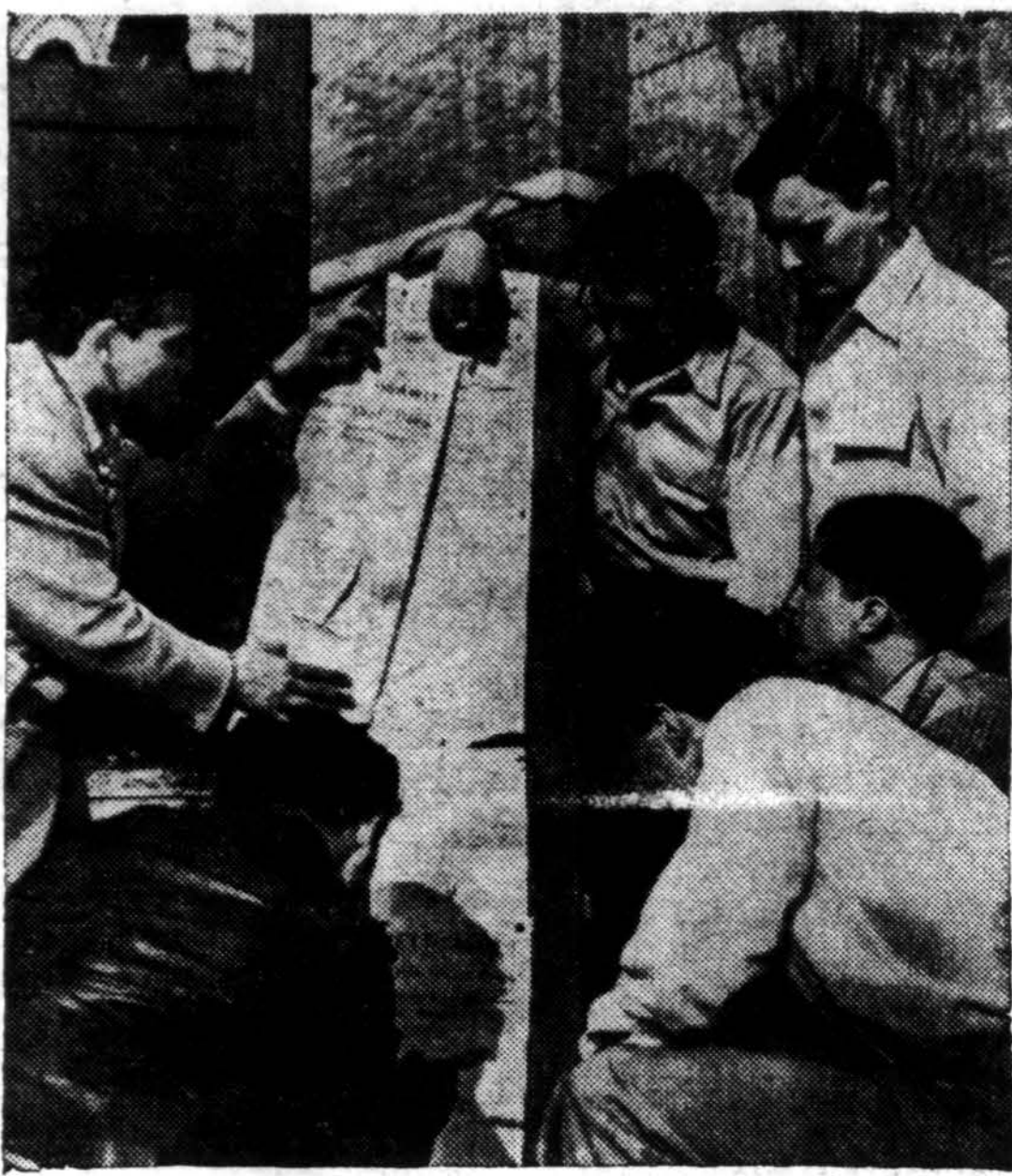
California Universiteto, Los Angeles, studentai, pastarojo karo veteranai, suruošė demonstraciją protestui prieš MacArthur kandidatūrą į prezidentus.