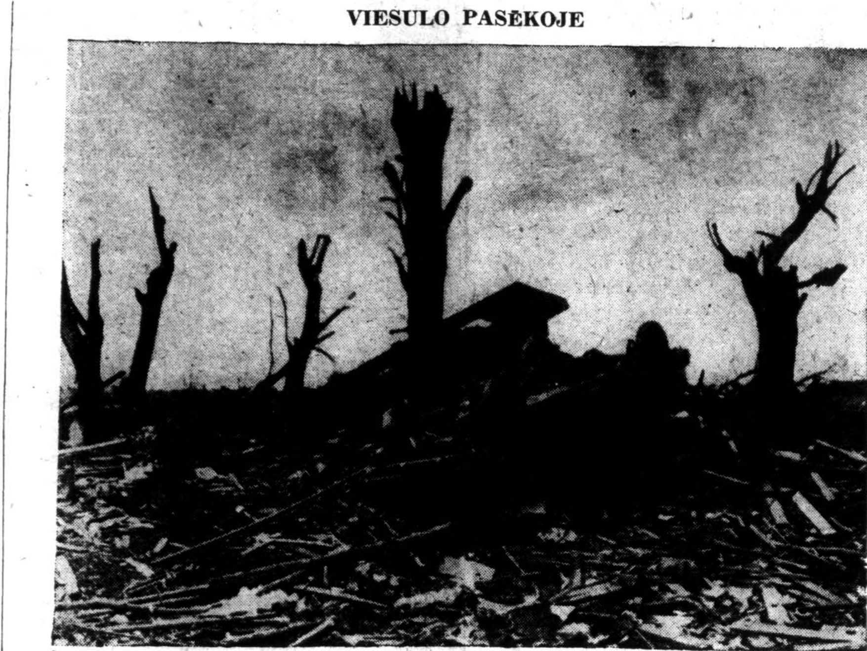
Apverstas ir sudaužytas automobilis gulis griuvėsiuose viesulo sunaikinto namo tarpe nulauztų medžių Fosterburg, Illinois. Šis vaizdas buvo tipiškasis sunaikinimo po to, kai viesulai dalyse penkių vidurvakariųjų valstybių. Keliolika asmenų buvo užmušti ir keli šimtai sužeisti.

Gi Prancūzijos politika tuoj po išlaisvinimo parodo,