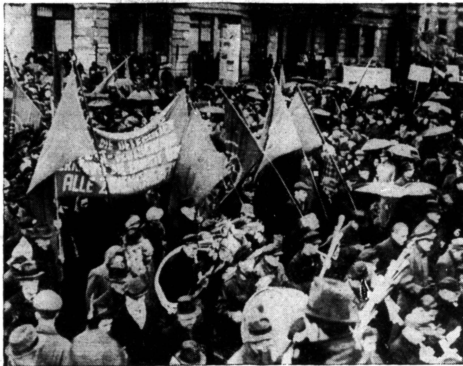
Vokiečių komunistai sovietų zonoje Berlyne mini 1848 metų revoliucijos sukaktį. Maršuotojai nešė vėliavas ir iškabas sakandias, "Laimėti laisvę, Marshall planas turi būti šugriautas." Tuo pat metu, britų zonoje Berlyne anti-komunistai taip pat minėjo tą sukaktį, smerkdami komunistus.