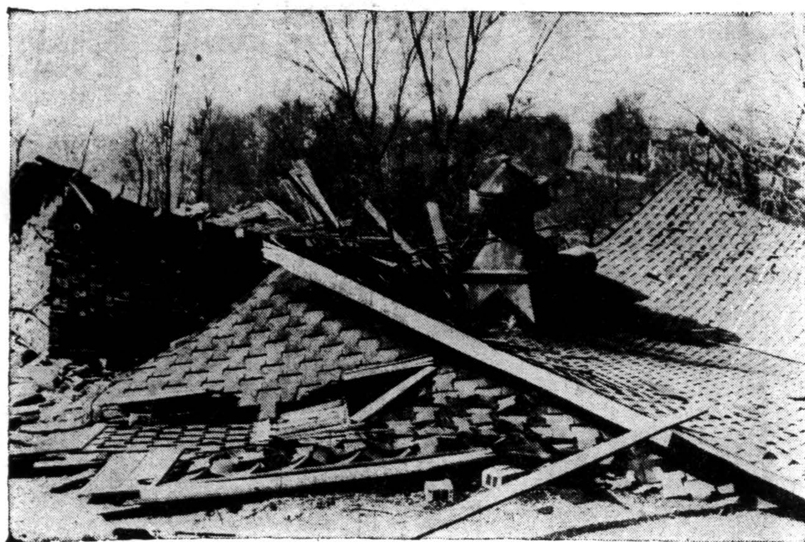
Nuo pastarojo viesulo labai nukentėjo Alton, Ill., miestelis. Griūdami namai ir virs-dami medžiai vienus panikos apimtus gyventojus mirtinai palaidojo, kitus sužeidė.