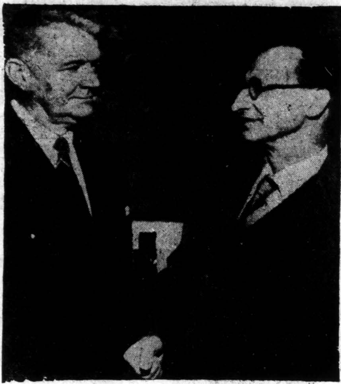
Alcide De Gasperi (dešinėje), vadas Italijos krikščionių demokratų partijos, kuris pastaruosiuose krašto rinkimuose laimėjo absoliučią didžiumą, kalbasi su Hugh Baillie, United Press prezidentu Romoje.