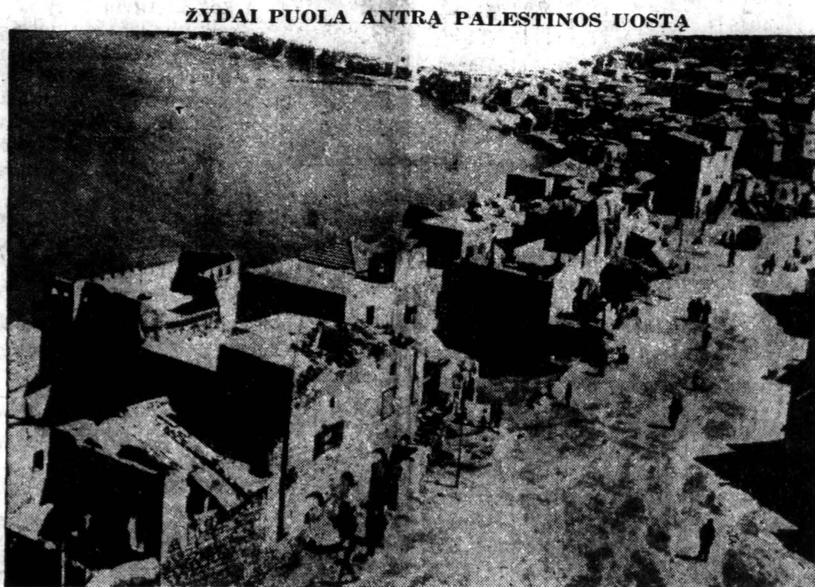
ŽYDAI PUOLA ANTRĄ PALESTINOS UOSTA

Jei Amerika dar iki šiam laikui Europai nėra davusi aiškios garantijos, jog ginstanti ją nuo sovietų agresijos, tai per Marshallą, prieš jam išvykstant į Bogotą, buvo duotas "penkiems" pasiūlymas, kad jie pirmą susitartų dėl bendros strategijos, suvienodintų ginklus, sudarytų bendrą karišką komisiją.