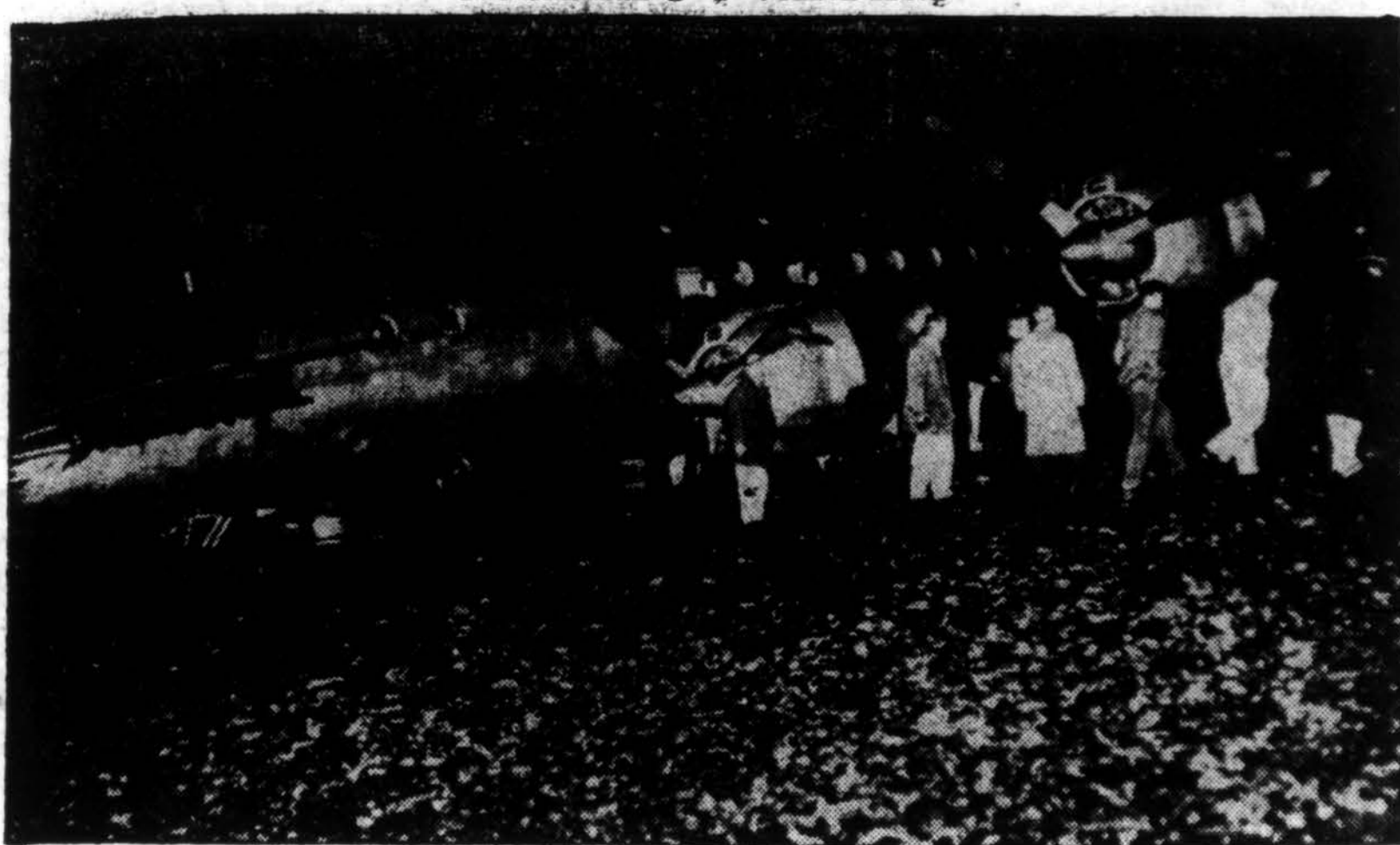
Pan American Airways Constellation lėktuvas, atskridęs į New York, vietoj nusileisti į La Guardia aerodromą, plumptelėjo į Bowery įlanką. Priežastis buvo ta: vairuotojo kambaryje staiga priėjus dūmų jis negalėjo matyti tikrojo kelio. Lėktuve buvo tik tai keturi žmonės, iš kurių vienas sužeistas.

NGAUROHOE, N. Zelandija. — Netoli šio kaimo atgijo Ngaurhoe kalno vulkanas, kuris buvo apmiręs nuo 1926 metų. Iš vulkano paleisti dūmai neša pelenus net 140 mylių. Išsilėjęs lava grasina kaimą, ir gyvenotojai išsigandę apledo savo namus ir bėga į saugesnes vietas.