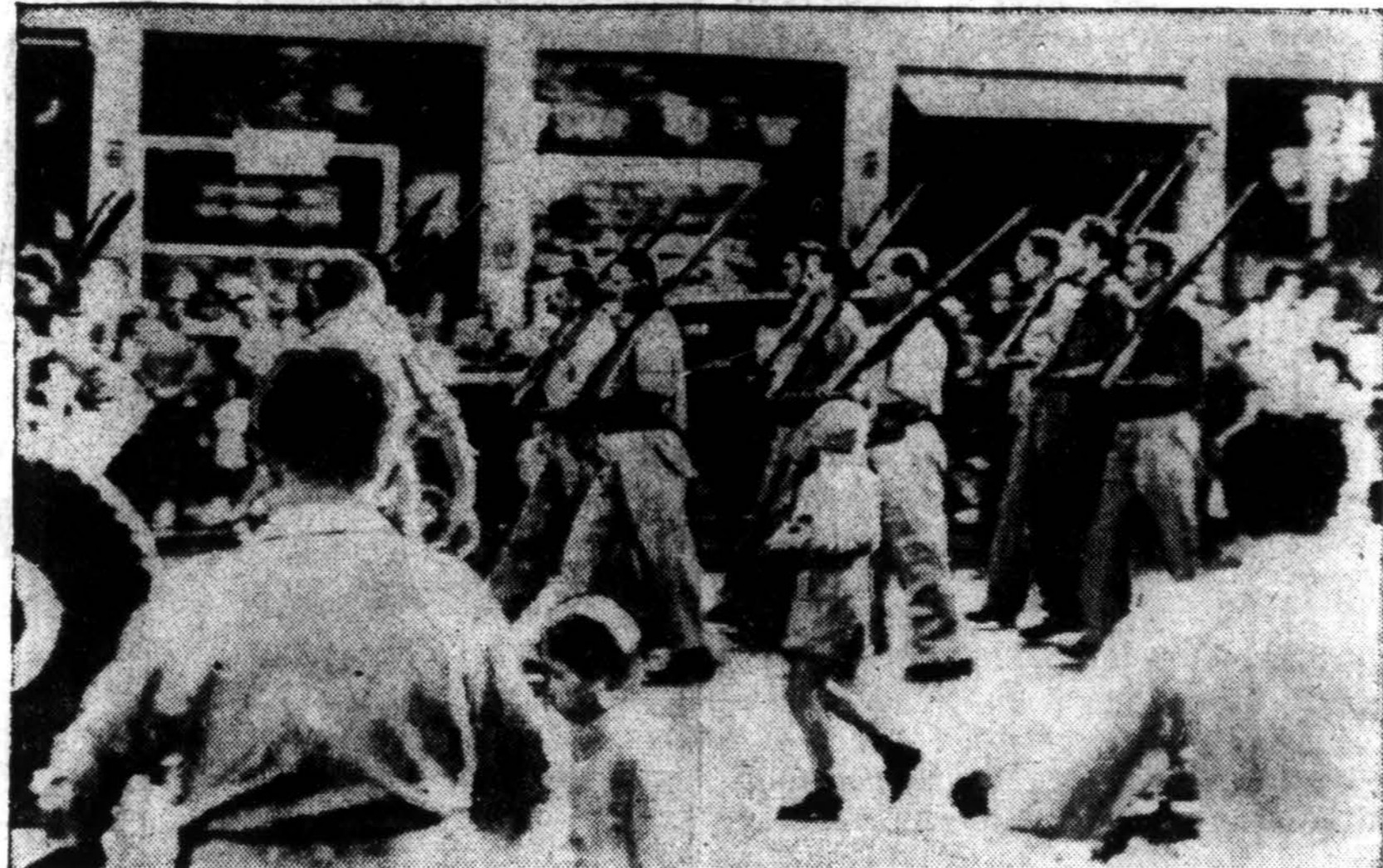
Haganah kariai paraduoja per Haifos miesto gatves celebruodami laimėjimą naujosios Israelijos valstybės įsteigimo proklamavime.