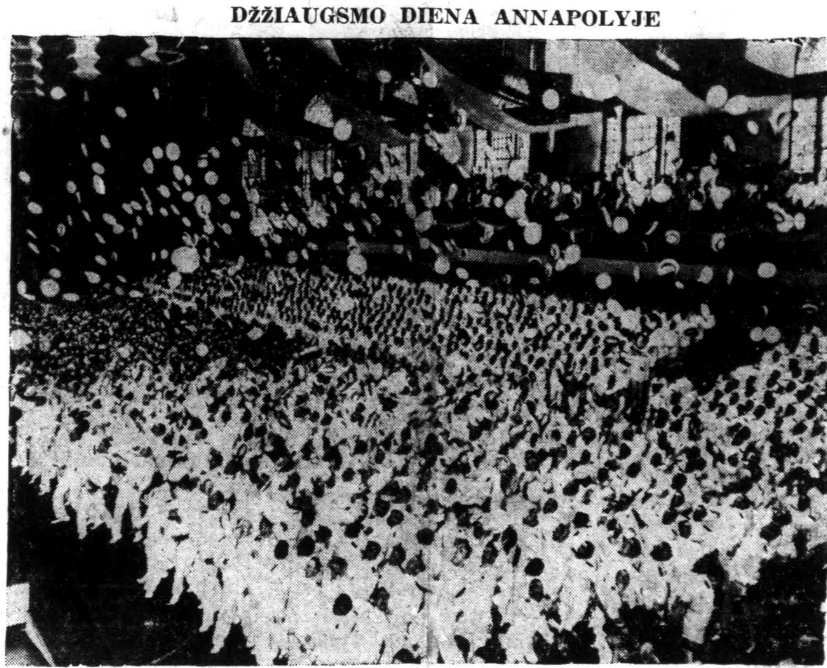
Tradicinė mada, U. S. laivyno akademijos kursus baigiant studentai išmeta oran savo kepures po to, kai buvo išdalinti jiems dip lomai.