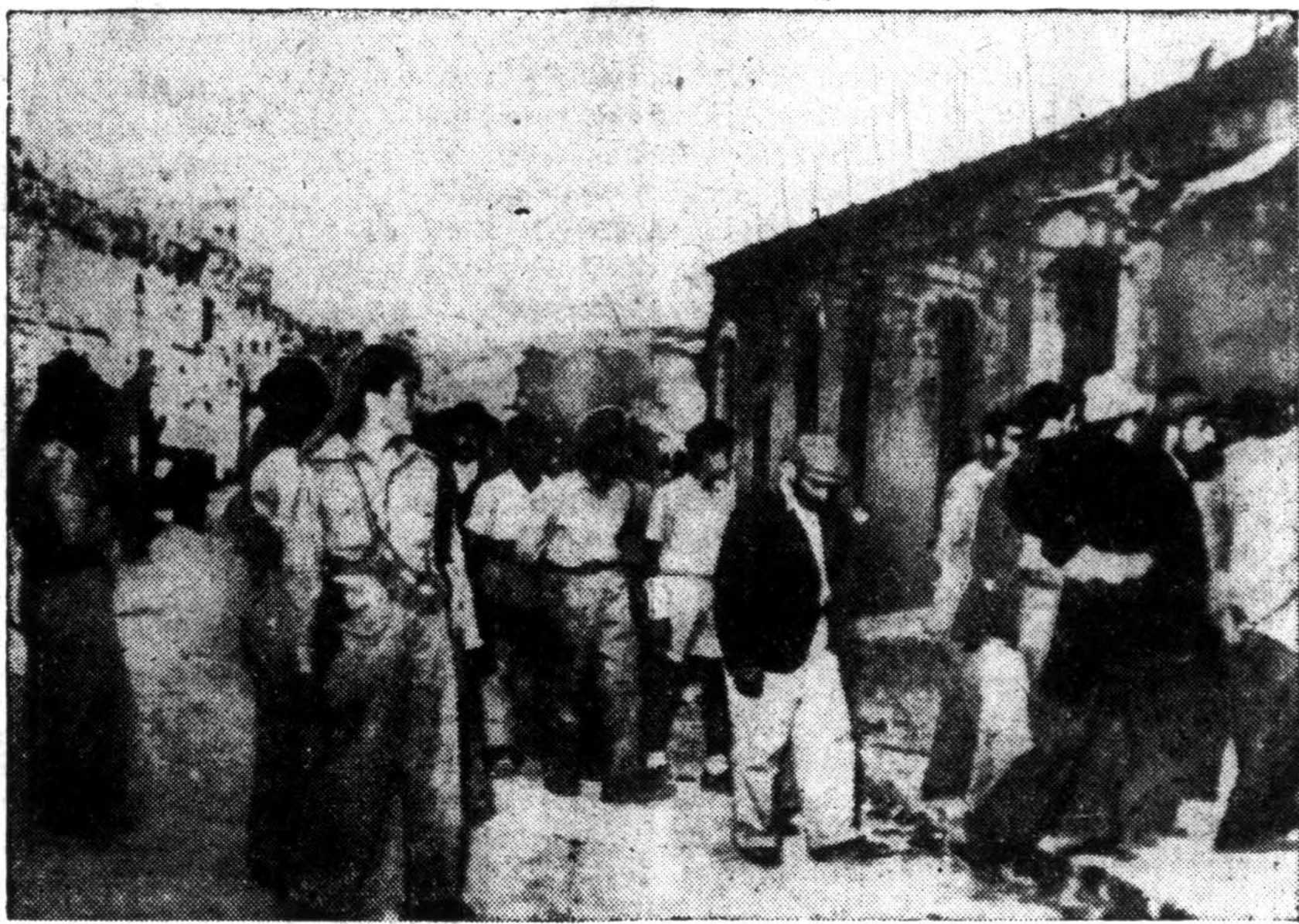
Apdriškę ir išvargę, nugalėti žydai gynėjai senjo Jeruzalės miesto žygiuoja pro arabus laimėtojus po to, kai žydai formaliai pasidavė toje istorinėje Palestinos dalyje, po 11 dienų aršaus arabų puolimo.