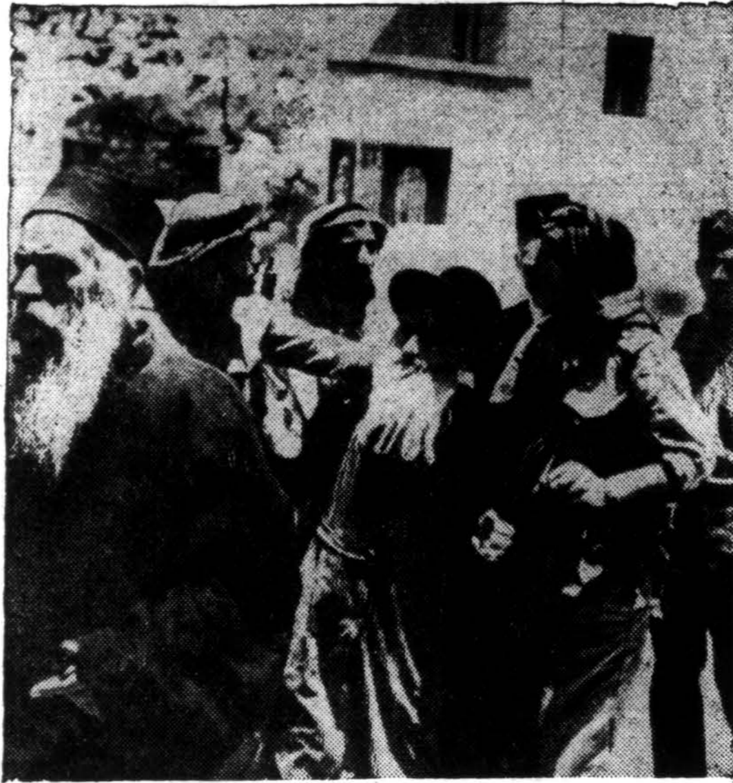
Jeruzalės miesto senoj daly gyveną žydai pasijuto bejėgiai, arabų apsupti. Naujoj miesto daly žydai dar kovoja.