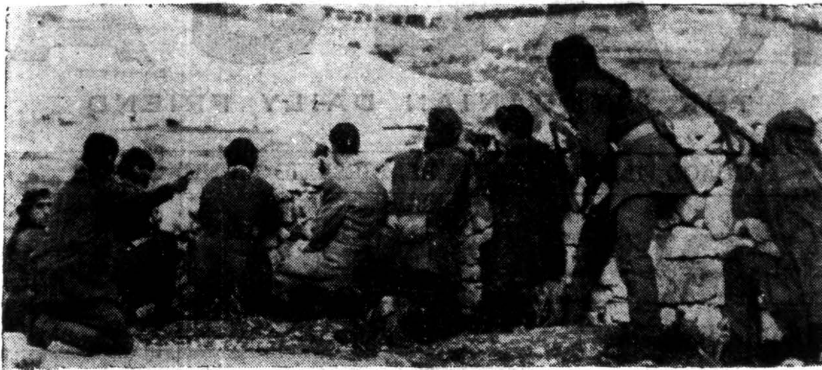
Už Jeruzalio, šalia Alyvų kalno, arabų kareiviai apkasuose laukia pasirodymo žydų kareivių. Anapus kalno yra žydų apkasai.