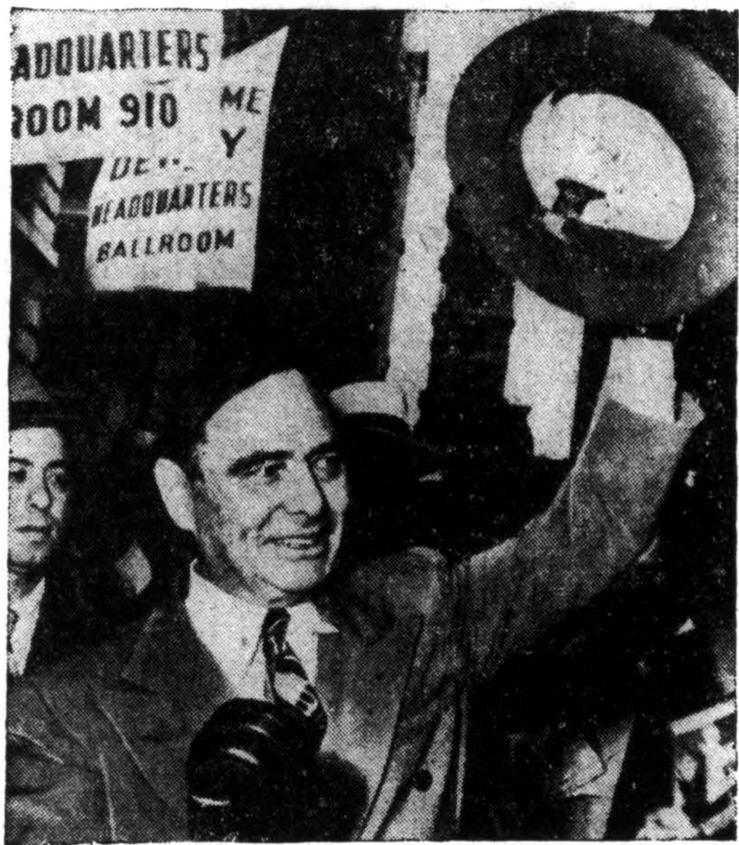
Kongr. Joseph W. Martin, nuolatinis respublikonų partijos suvažiavimo pirmininkas. Nuotrauka padaryta jam atvykus į Philadelphia, Pa. Jis taip pat siekia nominacijos kandidato į prezidentus.