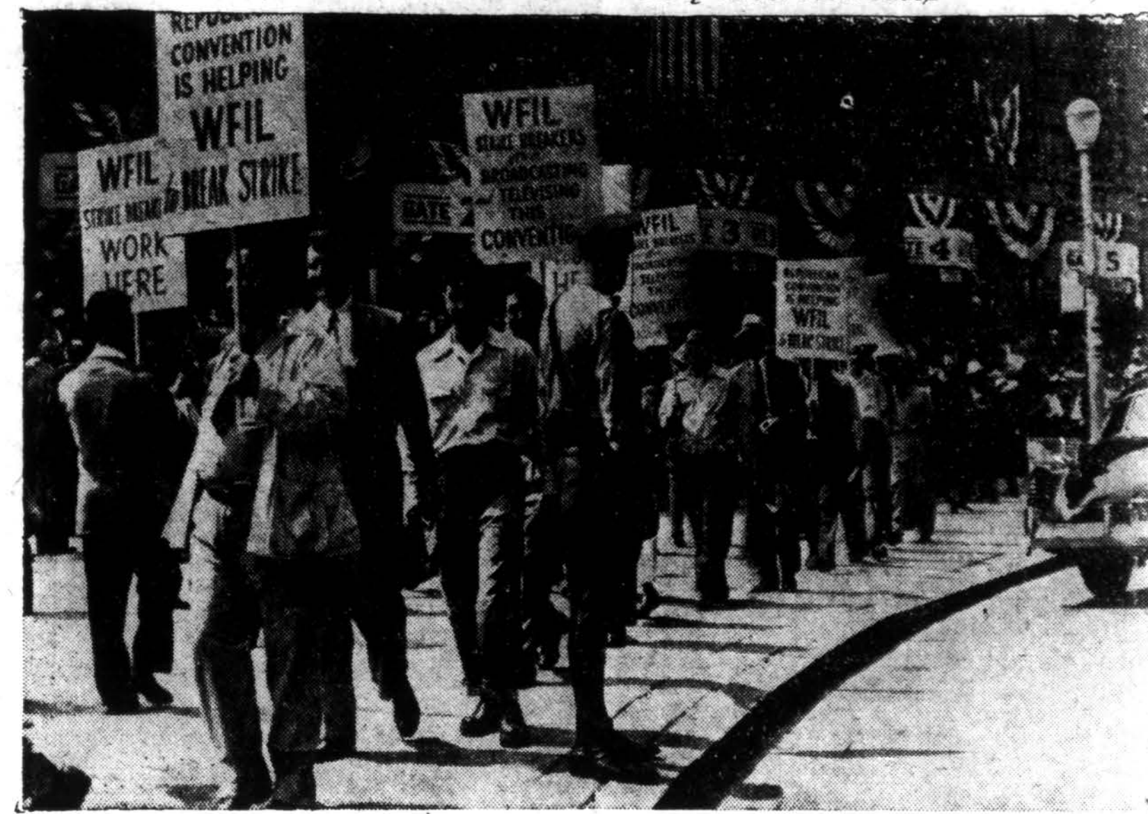
GOP nacionalinei konvencijai susirinkus Philadelphiaj, American Communications Association (C.A.) pastatė šias pikietinių linijas prie konvencijos salės. Unija padarė tą už tai, kad suvažiavimo komitetas atsisakė užginti transliavimo ir televizijos privilegijas radijo stotiai WFIL, prieš kurią unija streikuoja.