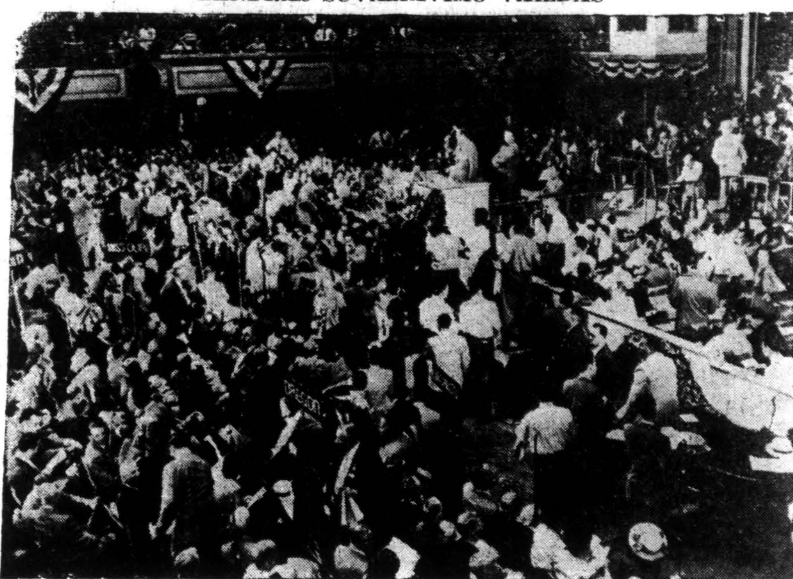
Bendras vaizdas respublikonų partijos suvažiavimo Philadelphia, Pa. Rytoj jau gal bus žinoma, kas yra išrinktas kandidatu į prezidentus.

(Toliau skaitysite: STALINAS MANE "ISLAISVINAMA")