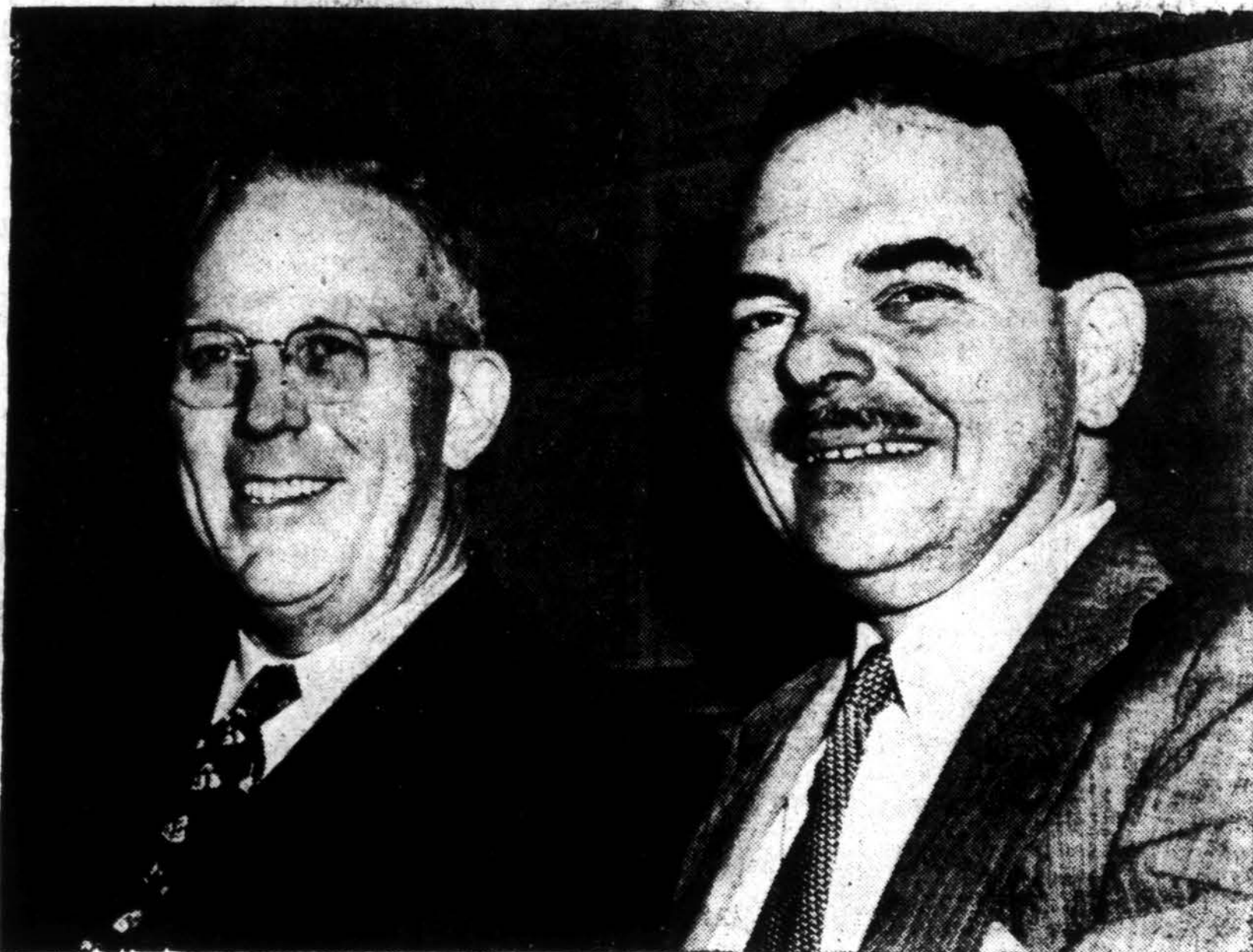
Šypsodamiesi, republikonų 1948 metų rinkiminės kampanijos vėliavos nešėjai gub. Thomas Dewey iš New Yorko ir gub. Warren iš California suėjo krūvon pirmą kartą po pastarojo nominacijos į vice prezidentus.