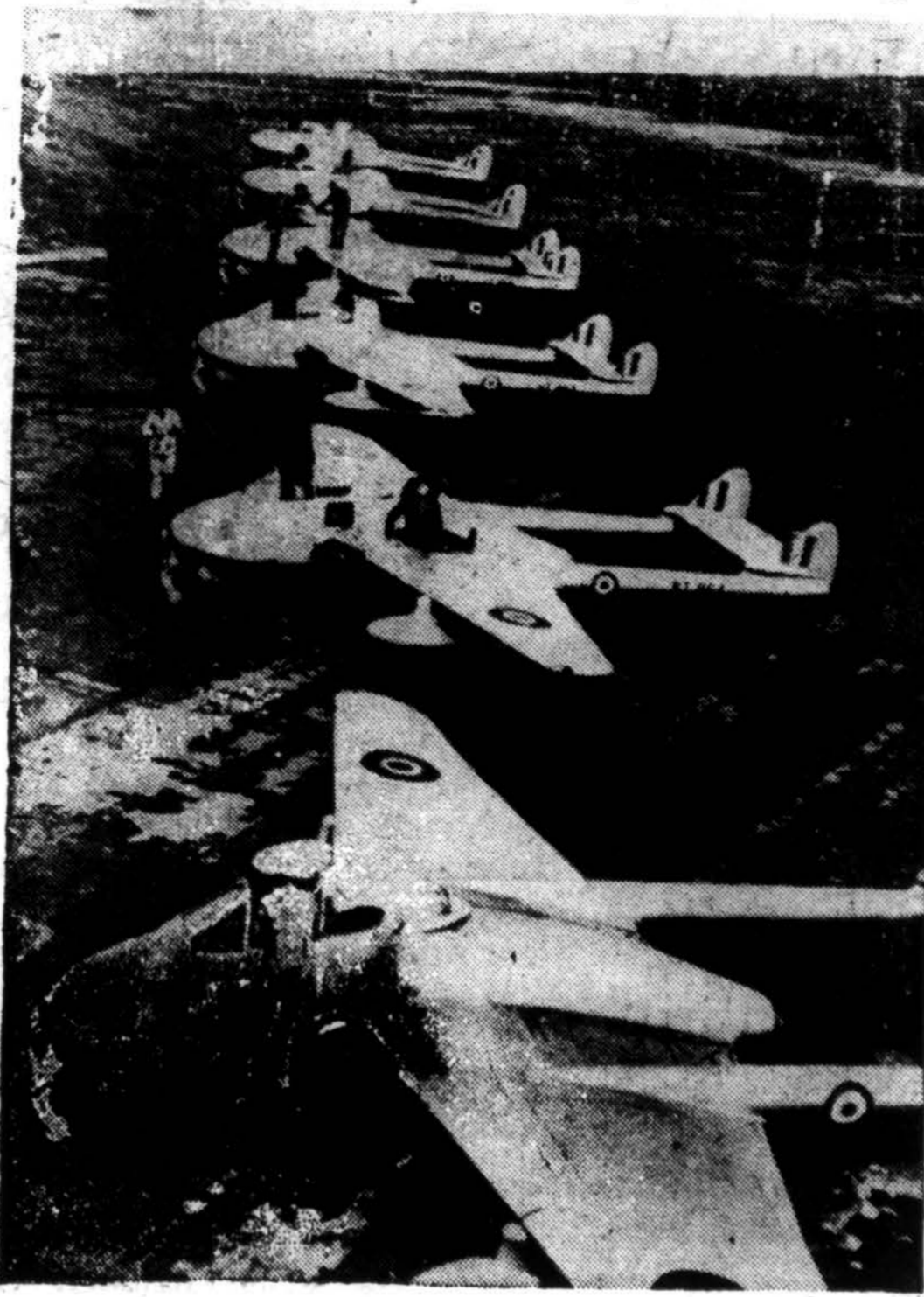
Pirmieji "jet" lėktuvai skristi per Atlantą, šie šeši De Havilland kovos lėktuvai stovi Olkham aerodrome, Anglijoje, pirm išskridimo į istorinę kelionę. Jie buvo sulaukyti Stornoway, Skotijoje, kuomet oro sąlygos suprastėjo.