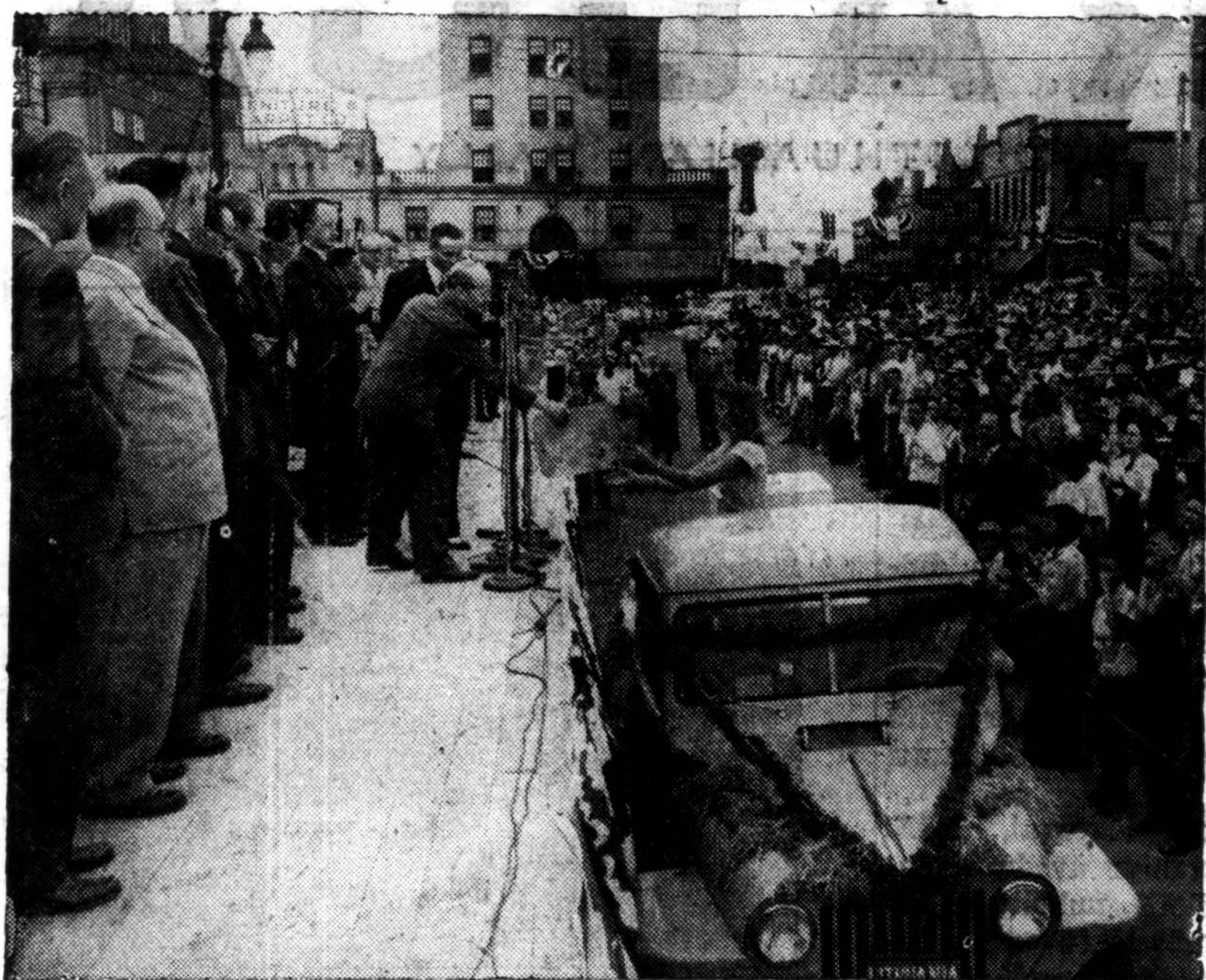
Indiana valstybės Limestone Pramonės Šimtmetinėje Parodoje, Bedford, Ind., birželio 17 d. buvo tarptautinė diena. Iškilmes dalyvavo 21-os valstybės atstovai.

teismo rūmų, plevėsavo 18 valstybių vėliavos, kurių tarpe Lietuvos trispalvė ir Amerikos Stars and Stripes.