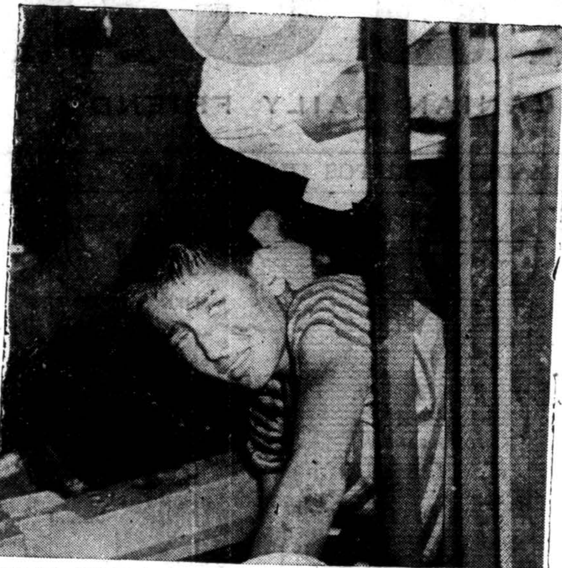
Čia yra Rumunai iš Chicago, 19 metų, laukia kantriai gaisrininkų, kad jį išvaduoti, kai jis pateko tarp kelto ir sienos.