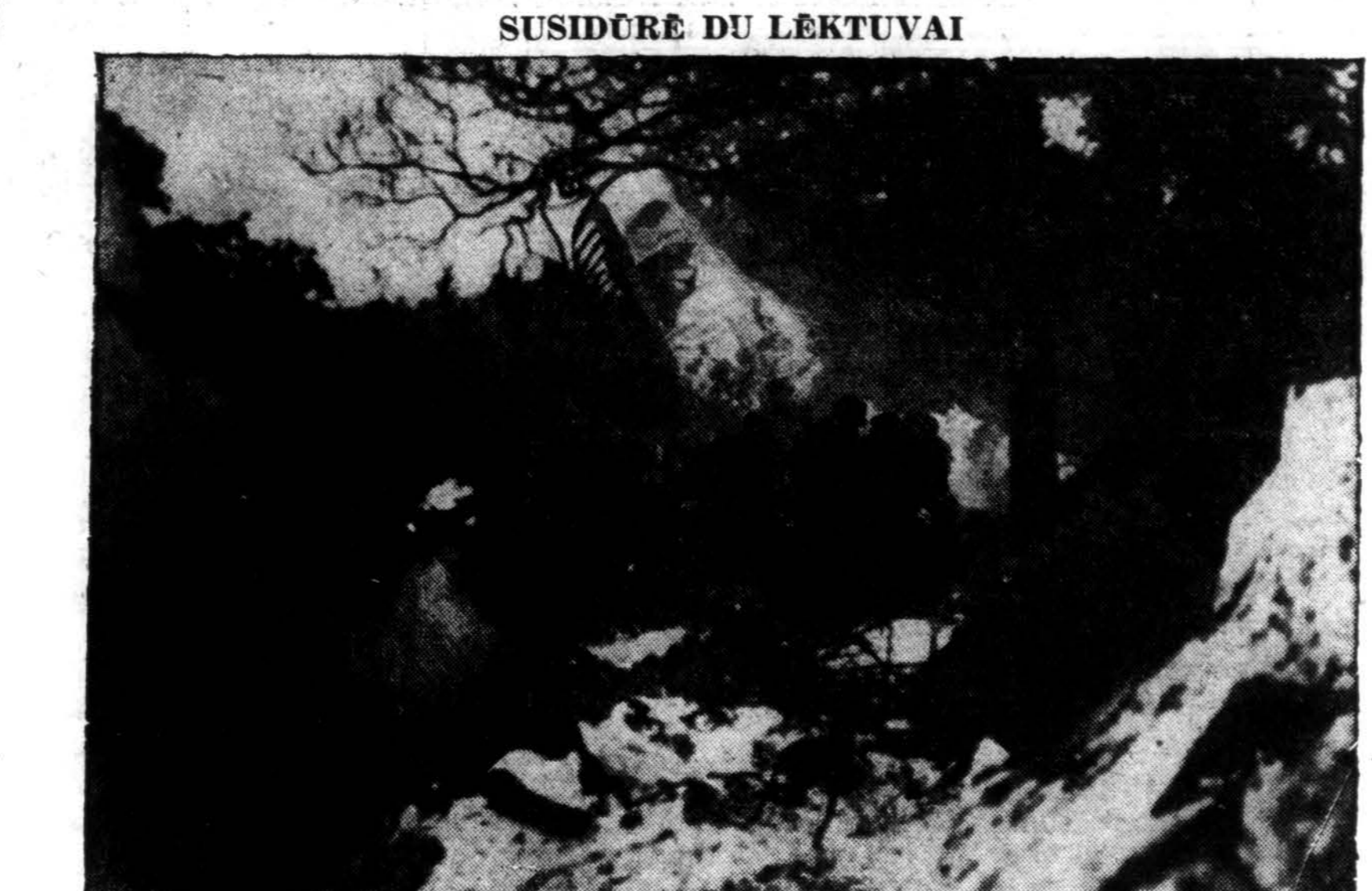
Gaisrininkai ir gelbėjimo darbininkai ieško tarp RAF, transporto lėktuvo, degėsių po to, kai jis susidūrė su Scandinavian DC-6 lėktuvu ir paskendo liepsnose. Du lėktuvai, kuris vienas kitą sutrenkė kai bandė nusileisti, priartėjus, lietuvi sauciant, Northolt airportą, netoli Londono, Anglijoje, vežė 39 žmones, visi žuvo.