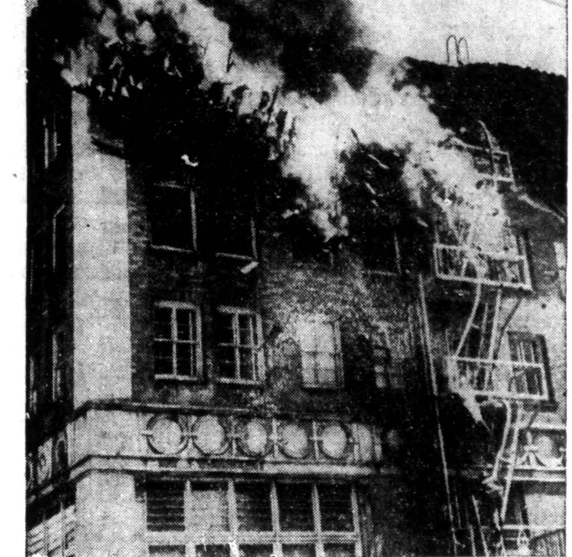
Del Mar viešbutyje, Santa Monica, Cal., buvo kilęs gaisras. Visi svečiai iš viešbučio buvo evakuoti.