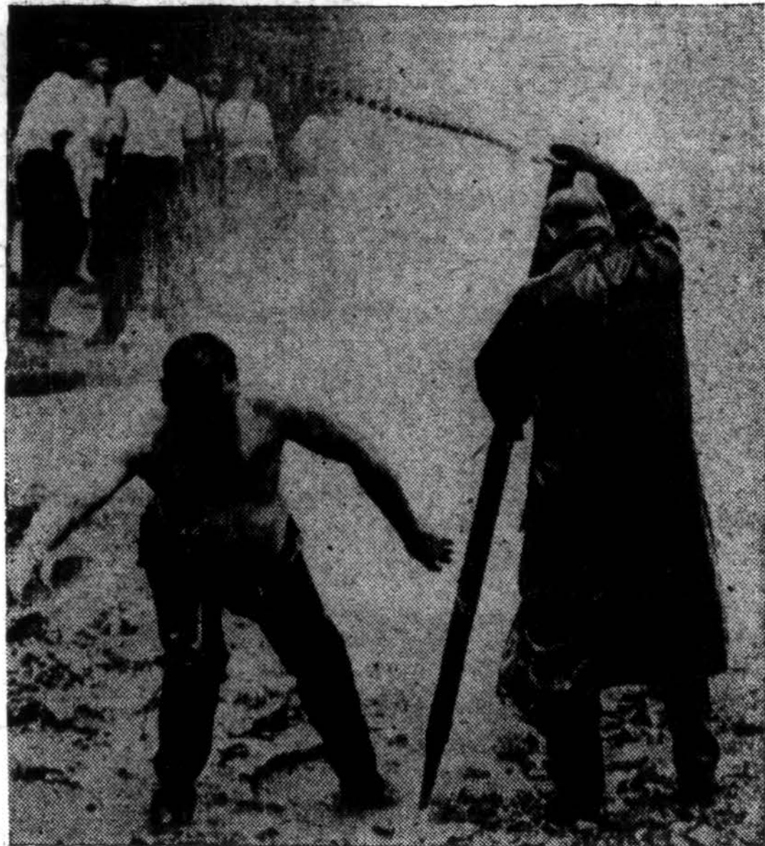
Kai Philadelphiaje, vienoje gatvėje, vanduo veržės, tai vandens biuro darbininkas koja sulaiškė vandenį.