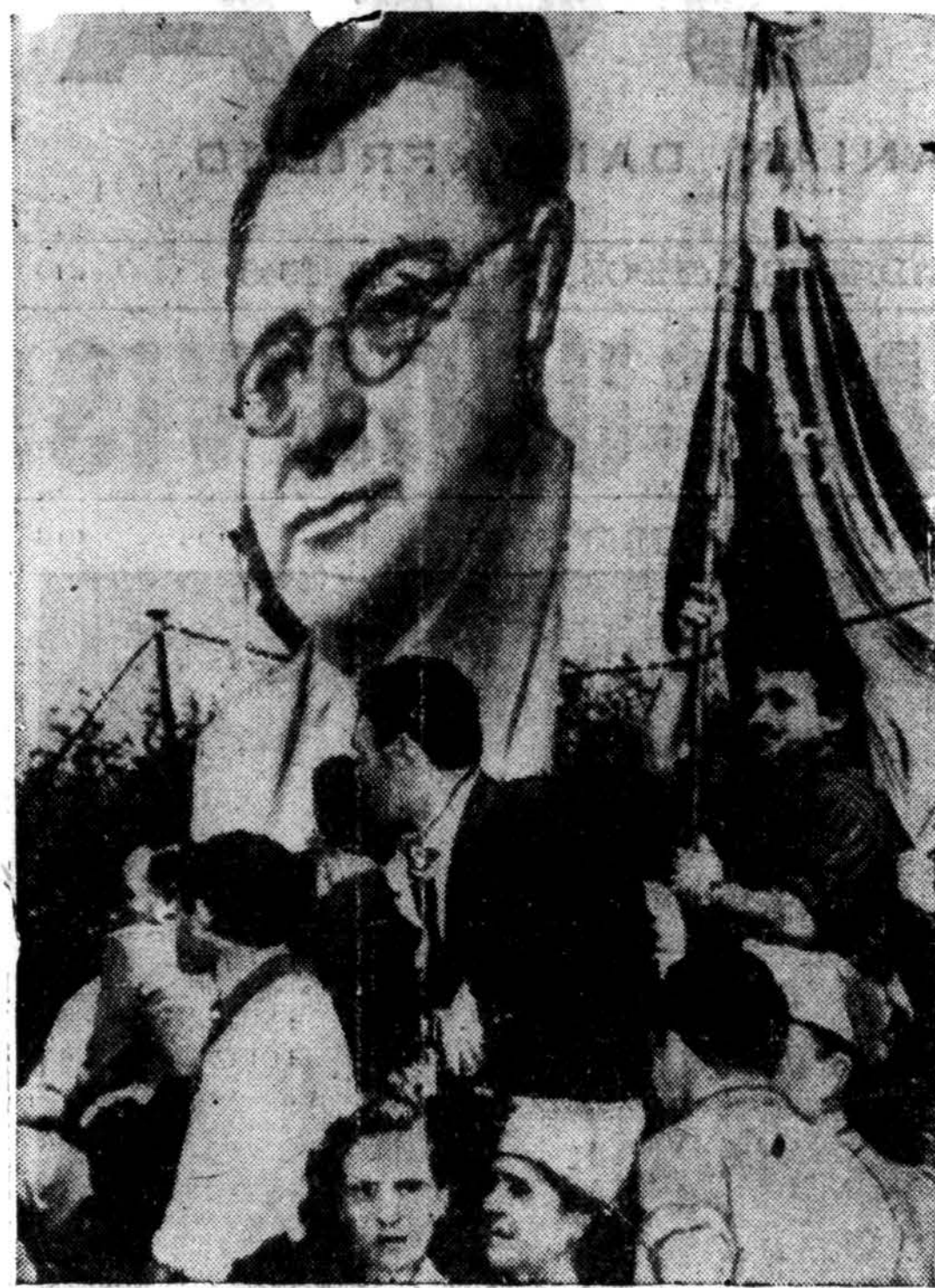
Italų komunistai paskelbė streiką, kai užpuolime buvo sužeistas jų vadas Palmiro Togliatti. Čia matome vaizdą Romos gatvėje, nešant Togliatti paveikslą.