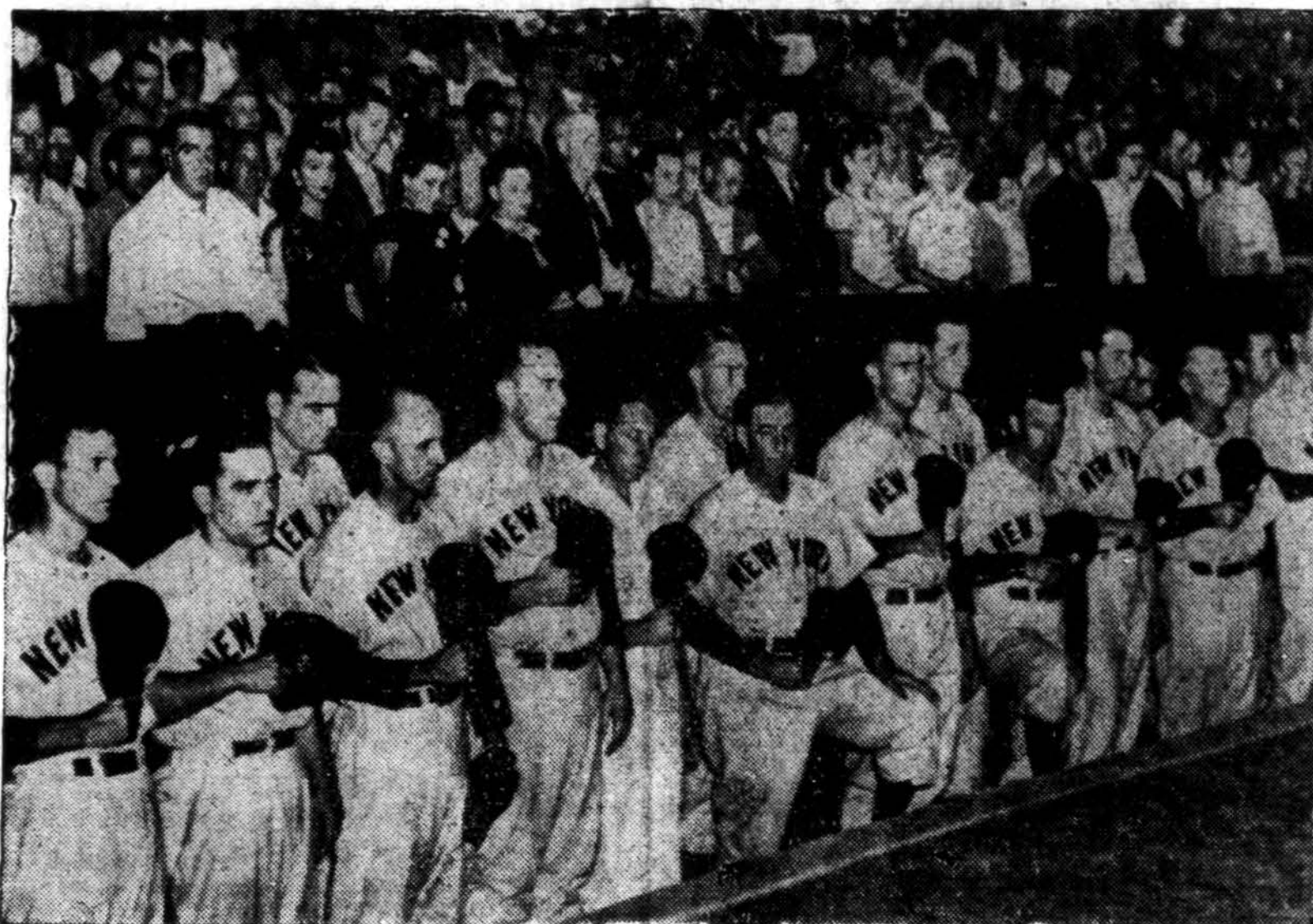
New Yorko miesto Polo Grounds, kur "Babe" Ruth pirmiausiai atsižymėjo "home run" išmušimu, New York Yankees beisbolo komanda ir žiūrėtojai sustoja minutės tyliai maldai po pranešimo, kad "Babe" mirė. Yankee komanda žaidė prieš Giants komandą pranešimo metu.