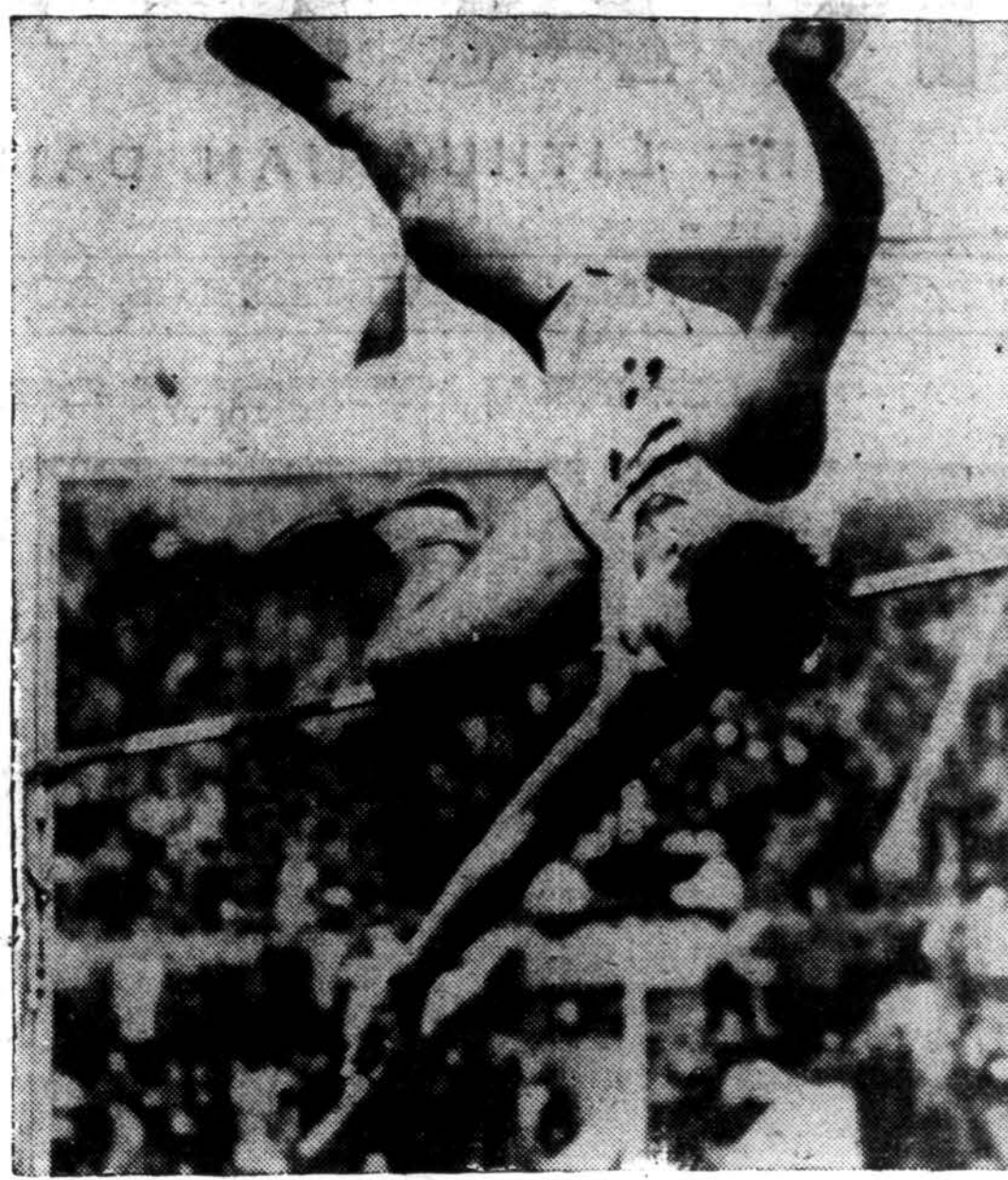
Bob Mathias, 17, iš Tulare, Calif., Tarptautinėje Olimpijadoje perskosta 6 pėdas ir 1 su ketvirčiu inčio į aukštį, laimėdamas šokime į aukštį pirmą vietą.