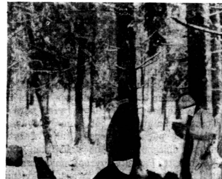
Lietuvos Laisvės Kovotojai, besiveržia pro "geležinę uždangą", išsisi Rytprūsiose, Heidemuode miške, 1947 m. gruodžio 21 d.

Mes jau buvome besitraukia nuo lango, kai staiga išgirdome rusišką balsą: "Stoj! Kuda idioš!" Likusiems pagriovyje draugams tyliai besikalbant, rusai nematomi priėjo ligi trobos. Nebuvo daugiau kas daryti, kaip ruselius sustabdyti. Mes jiems keistai pasirodėme. Susivarėme juos į vidų, paprašėme gerti ir ramiai sau šnekučiavomės, vaidindami prieš juos raudonarmiečius. Išklausinėjome apie artimuosius kolchozus ir kitas vietas. Pats pirmasis vadinosi "Kirov". Jie esą kaip tik to kolchozo baudžiauninkai ir grįžta dabar iš darbo. Mes žadėjome grįždami iš miestelio užsukti su degtine ir cigaretėmis, — kad tik jie laikytųsi ramiai.