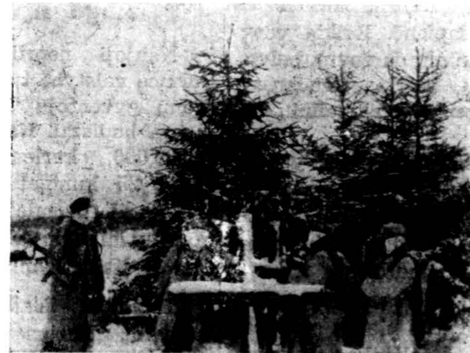
Lietuvos Laisvės Kovotojai Rytprūsiose, Heidemede miške, prieš kautynes su bolševikais, kuriose trys iš šešių žuvo. Kautynės įvyko 1947 m. gruodžio 21 d. vakare.

Ėjome visą laiką pėda į pėdą, kas labai vargino pasukiniuosius. Keletą kilometrų paėję užtikome buvusios karo metu stovyklos likučius, Sniege, jaunų eglaičių fone, buvo matyti karių kapų mediniai kryžiai. Aišku, tai buvo vokiečių karių kapai, nes bolševikai šitaip savo žmonių nelaidojo. Ant kapų kryžiaus vietoje jie deda savo raudonąsias "kaburkėles".