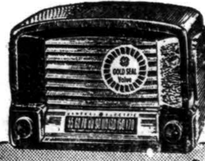
RCA Victor General Electric, Philco, Zenith ir Stromberg-Carlson radijos ir Television setai.