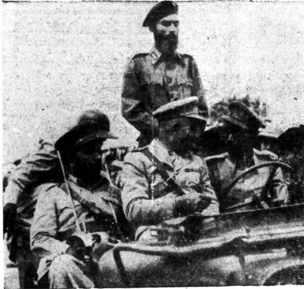
Kasim Razvi, Hyderabad savanorių kariuomenės vadas, prima kariuomenės parada Hyderabad'o valdovo gimtadienio proga. Indų kariuomenė įsiveržė į Hyderabad, kuomet valdovas atsisakė paleisti savo kariuomenę.