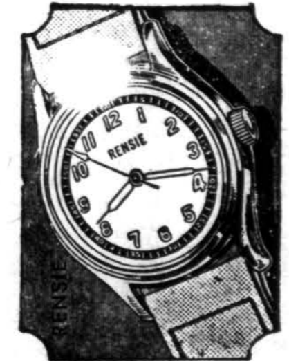
Bulova, Elgin laikrodžiai. Keepsake delmantiniai žiedai, Rogers ir Community šėdabniai, setai. Auksinės rašomos plunksnos: Schaffer, Parker, Waterman ir "Feversharp".

REKORDAI: Victor, Columbia, Decca, Continental.