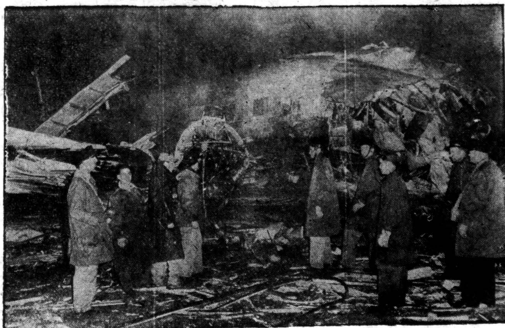
Būrys žmonių apžiūri likučius C-47 karo lėktuvo, kuris nukrito ant dviejų negyvenamų barakų Chanute Field, Ill. Lėktuve buvo 21 asmuo, iš kurių 3 žuvo. Lėktuvas užkliudė barakus leisdamasis.