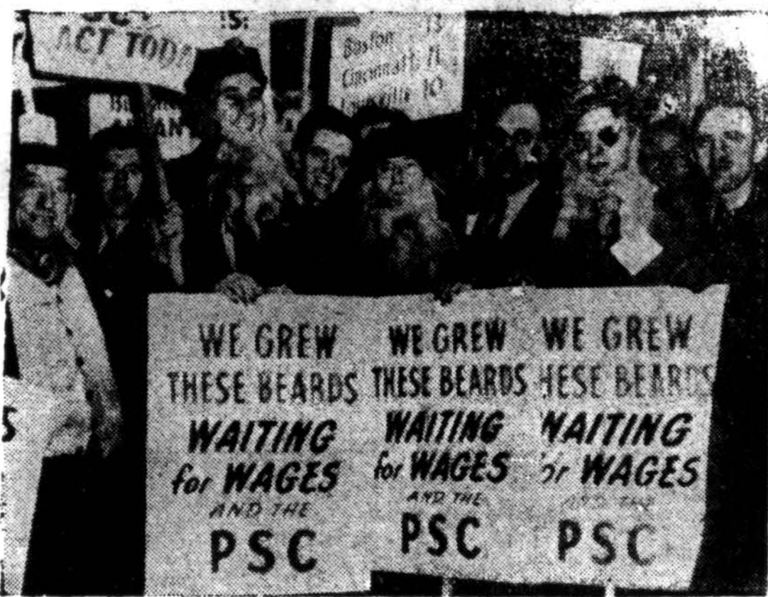
New Jorko busų soteriai buvo pasruošė strekui, bet streikas baigėsi beveik neprasiđėjęs.