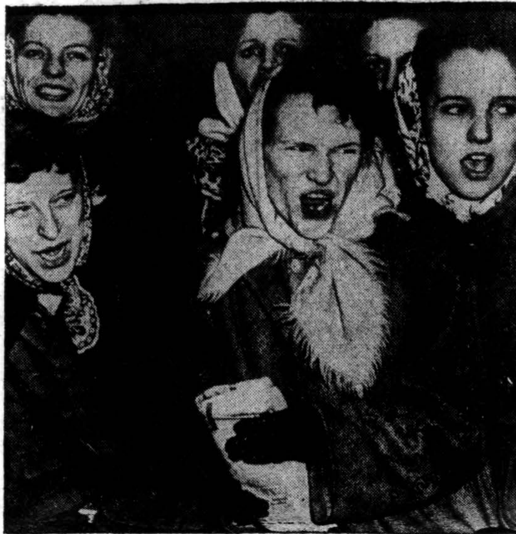
Streikuojančios darbininkės rodo savo nepasitenkinimą, kuomet kiti darbininkai per pikietų linijas vis tiek eina į darbą Clippard Radio Laboratory, Inc., Cincinnati mieste.