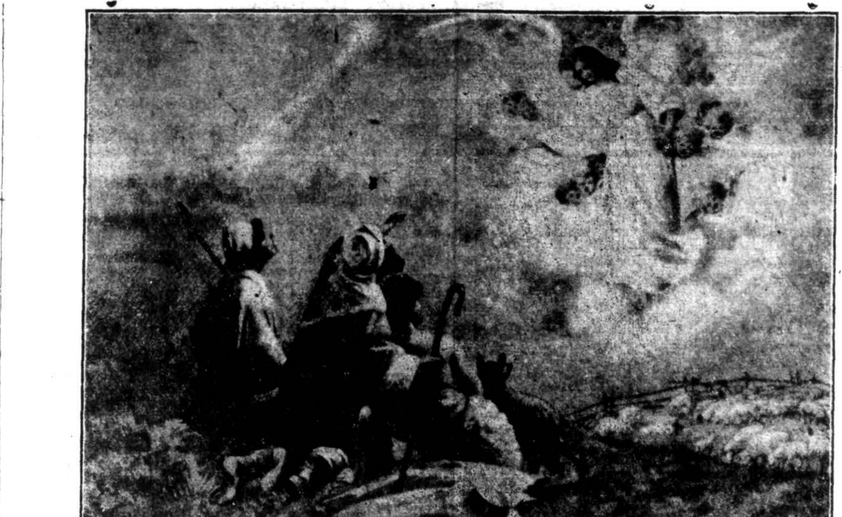
"Štai, Viešpaties angelas atsistojo prie jų, ir Dievo skaistumas apšvietė juos. Jie labai nusiramdo, bet angelas jiems tarė: 'Nebijokite! nes štai aš skelbiu jums didį džiaugsmą, kuris bus visai tautai, kad šandien jums ėmė Dovydo mieste išganytojas Jis yra Kristus Viešpats, ir tas bus jums ženklas: rasite kudišką suvystytą vystyklais ir paguldytą prokurtę. Ir čia aš atėdau prie angelo daugybę dargiškosios karūmenės, kurie stovino Dievą ir sakė: 'Garbė Dievui aukštybėse ir ramybė žemėje geros valios žmonėms!' (Luko 2, 1-14).

— Argi galėčiau miegoti? — Taip, — pasakė kiškis. Žmogus matė, kokiais puik-