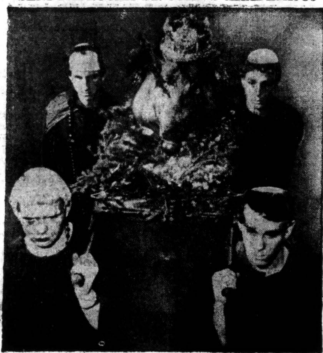
Apsirengę senais angliškais rūbais, St. John's Karinės Akademijos studentai, Delafield, Wis., pradėdami Kalėdų atostogas, laikosi senų angliškių papročių. Lygiai tokie patys papročiai laikomi Oxford'o Universitete Anglijoje.