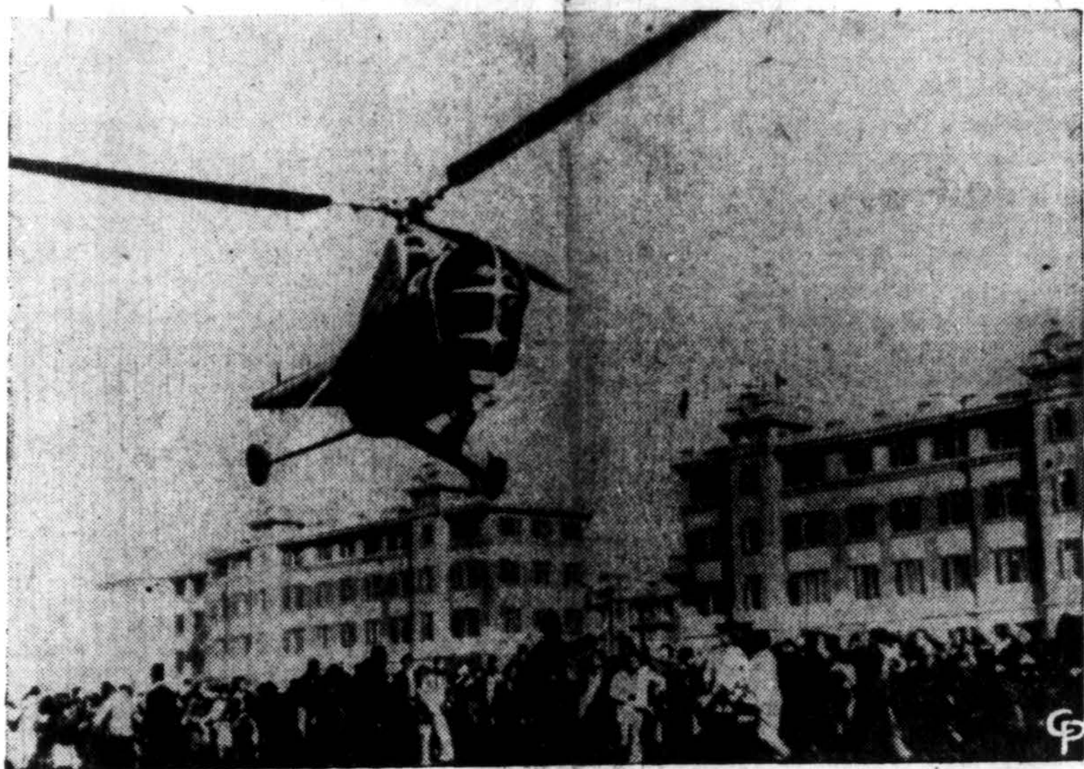
Kai Egipto karališkai šeimai gimė sūnus, keli tūkstančiai ubagų gavo nemokamus pietus, įsteigtos kelios stipendijos studentams, buvo apdovanoti tą pačią dieną gimę ir nekarališki berniukai. Smalsuolių gi minios, kurios rinkosi prie karaliaus rūmų, iš helikopterio buvo apmėtytos saldainiais. Čia ir matomas tą pareigą atliekantis helikopteris.