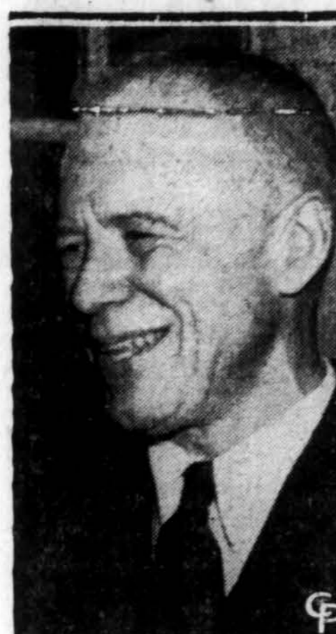
Robert P. Patterson, 61 m., advokatas, teisėjas ir buvęs karo sekretorius nuo 1945 iki 1947 m., žuvo lėktuvo katastrofoje Elizabeth, N. J.

mase. Tokia kovos taktika pasirodė esanti perdėm klaidinga. Be aviacijos paramos kariuoti neįmanoma. Štai kodėl jie šiandien reikalauja leidimo paliaubų metu statyti aerodromus. Vieną naktį jį juos būtų galima permesti šimtus Mandžiūrijoje laukiančių sprausminių naikintuvų. Karinės jėgos tada išsilygintų ir, reikia manyti, nusvertų komunistų naudai, nes jie turi daugiausiai kariuomenės, negu sąjungininkai.