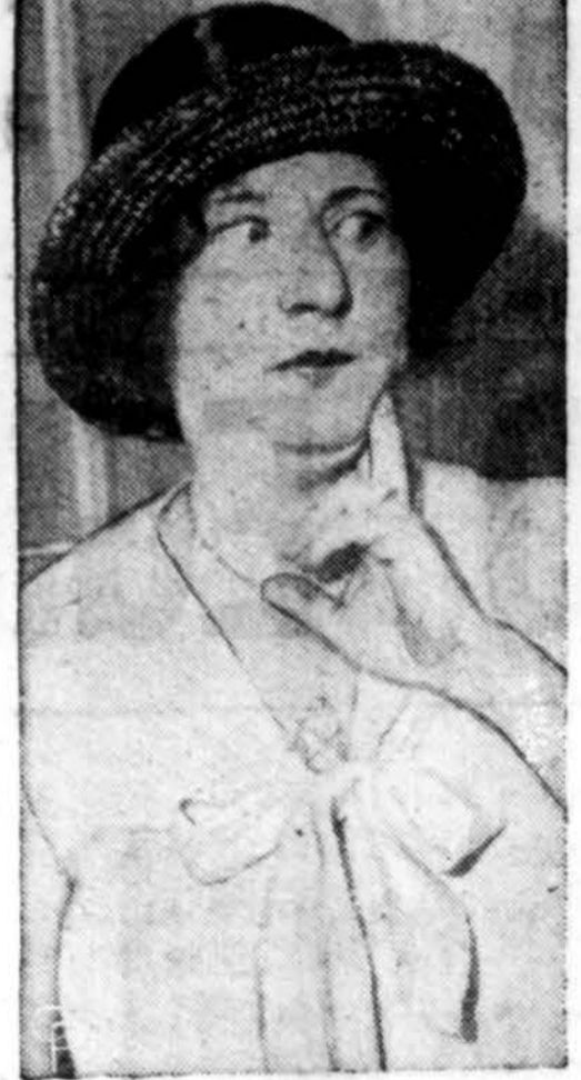
Polly Moran, artistė, 68 metų, 1915 metais pradėjusi artis- tės karjerą, žymi komedijan- tė, dabar kovojanti su mir- timi, Los Angeles ligoninėje.