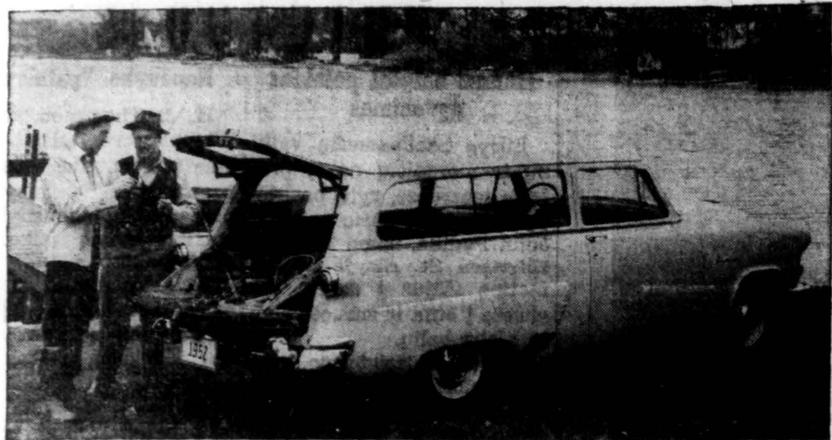
1952 metų Fordo "Ranch Wagon", kuris patogus biznio ir kitiems reikalams.