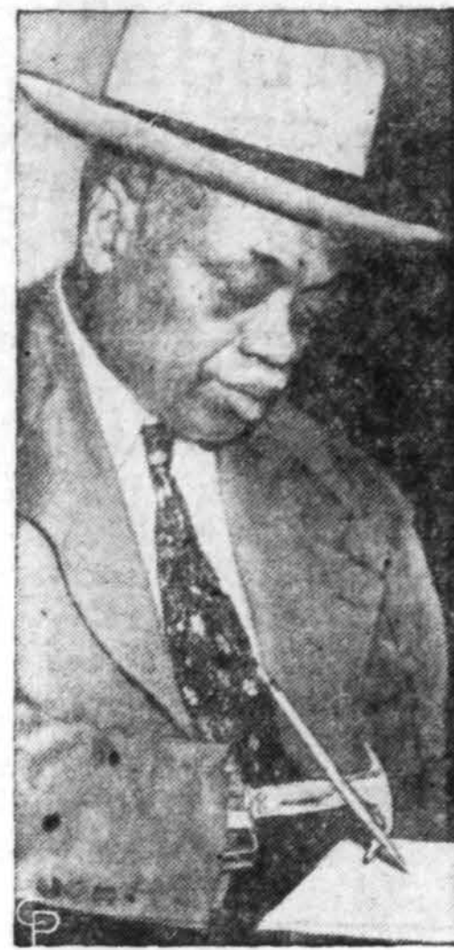
Stai kaip rašo berankis vyras

sovai kurį laiką buvo tarpriame kontakte su amerikiečių karinėmis pajėgomis, išdėstytomis Austrijoje, bet po 5 mėnesių ir jis staiga dingio.