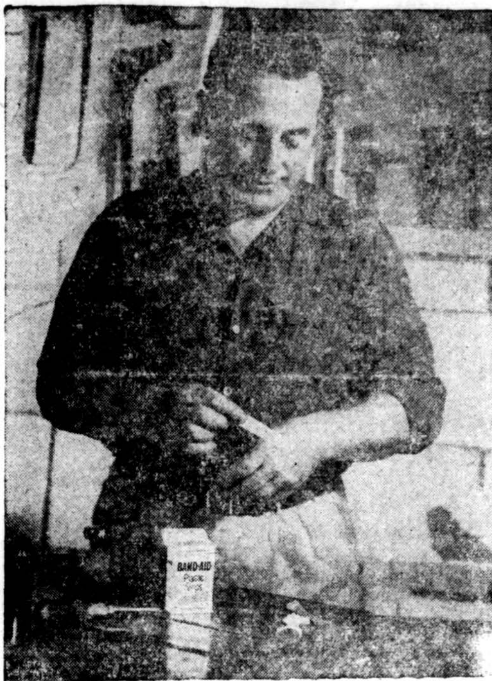
Susizeisti lengva. Zaizdą gi apsaugoti nuo užskrėtimo-infekcijos — labai svarbu. Dabar išrasta plastikinių — kūno spalvos — tvarsčių. Jais užlipinus suzeistą ranką ar veidą — ir pastebėt sunku, kad kas užlipinta.