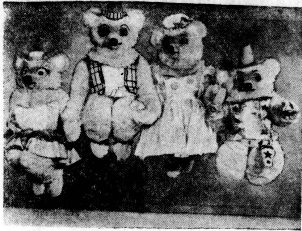
"Teddy Bear" šeima pasiruošus savo numeriui ledo spektakly, kuris prasidės kovo 24 d. Chicagos Arenoj, 333 E. Erie St., ir tęsis iki balandžio 9 d.