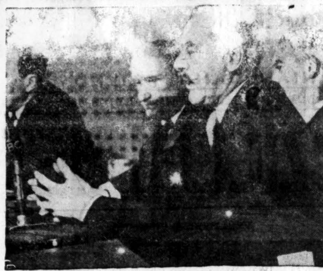
Jungtinių Amerikos valstybių sekretorius Dean Acheson kalba NATO suvažiavime Lisabonoje. Netoli jo (iš kairės) yra Kanados Lester Pearson, Prancūzijos Robert Schuman ir Britanijos Anthony Eden. Sudarė apsiginklavimo programą 1952 m.