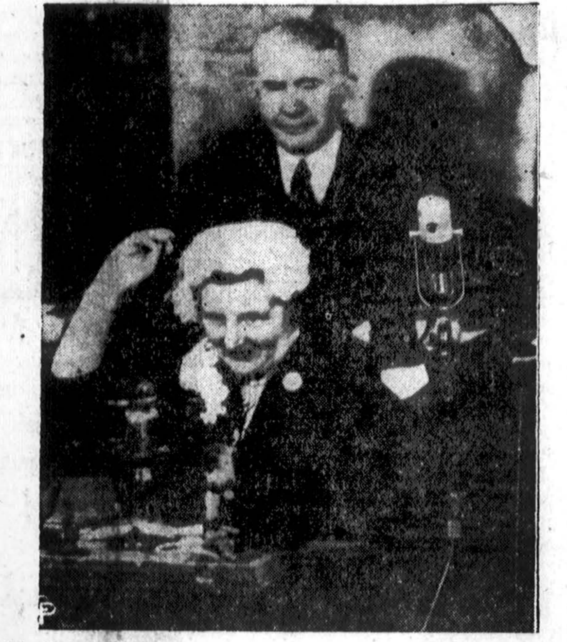
Olandijos karalienė Juliana kalba JAV kongrese. Už jos matosi senato pirmininkas ir viceprezidentas A. Barkley. Ji padėkojo Amerikai už Olandijai suteiktą ir teikiama pagalbą ir pareiškė, kad tikrasis kelias pasaulio vienybei ir taikai sukurti dar nėra surastas.