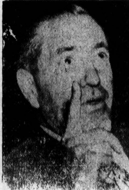
Pašalinto Attorney General McGrath vienon prezidentas tuojau paskyrė Filadelfijos fe deralinio teismo teisėją McGranery ir jam pavedė įvykdyti įstaigų nuo kyšininkų apvalymą.