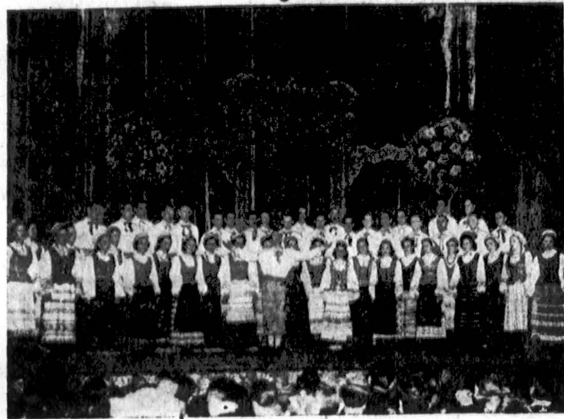
Garšusis Ciurlionio ansamblis, kuris gastraliuos balandžio 27 d., 3 val. p. p., Chicago Operos Rūmose. Tai yra jojo vienintelis pasirodymas šioje apylinkėje; programa bus visai nauja.

$1,000 skiria 1952 m. novelės premijai. Tapkite Ciurlionio ansamblio koncerto globėjais; sumokėkite $10.00 — gausite 2 bilietus po $3.10 ir vardas bus įrašytas į koncerto globėjų sąrašą programos knygoje. Bilietus ir globėjų narystes galite viet tik DRAUGO ofise užsakyti ar rezervuoti. Bilietų kainos sekančios: ložės $3.80 arba 8 vietų ložė $30.00; $10.00 koncerto globėjo narystė (su dviem bilietais po $3.10); $3.10, $2.50, $1.85, $1.25. Bilietus užsakykite asmeniškai arba laikais šiuo adresu: DRAUGAS, 2334 S. Oakley Ave., Chicago 8, Ill. Telefonuokite šiais numeriais: Virginia 7-6640-41-42.