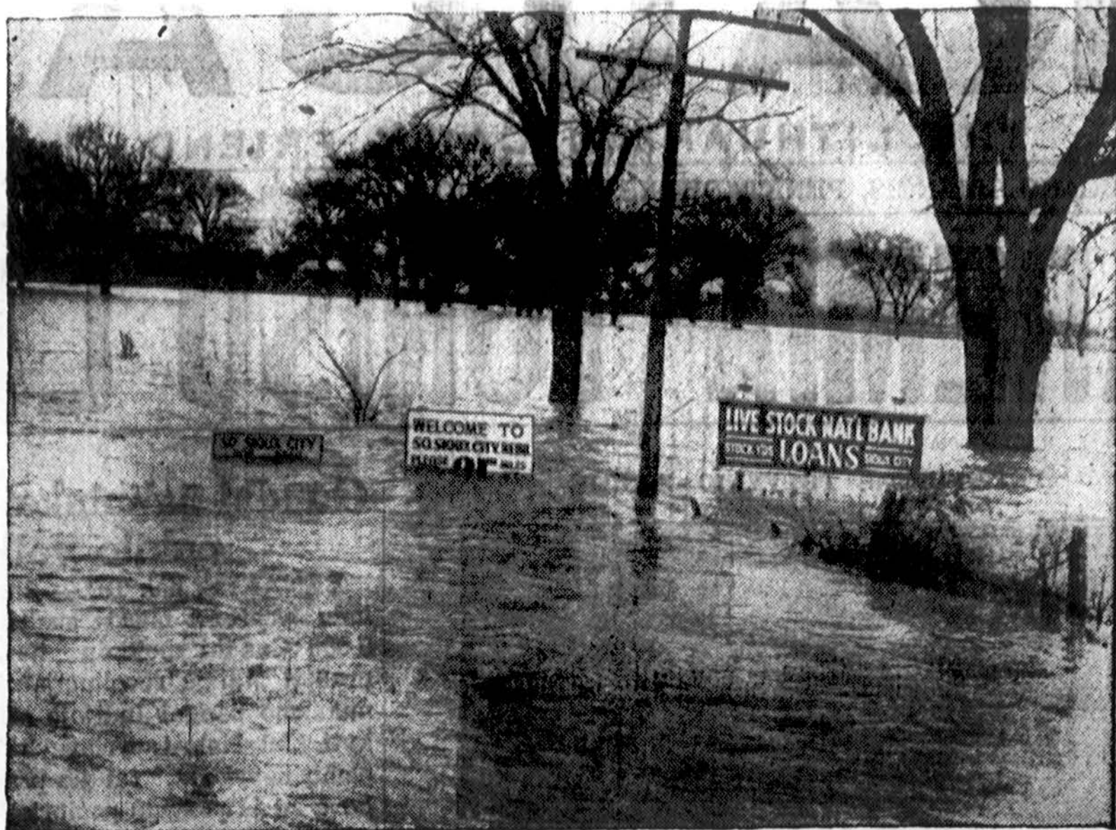
Ar į dešinę ar į kairę sukasi — vistiek tas pats. Vieškelio 20, vakaruose nuo South Sioux City, Neb., rodykliai beveik visai apsemti, kai Missiouri upė „dūksta“.