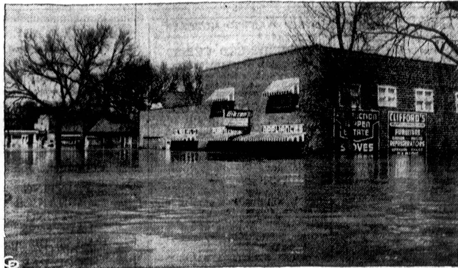
South Sioux City smarkiai nukentėjo nuo potvynio. South Sioux City gatvėse yra 8 pėdų gilumo vandens.