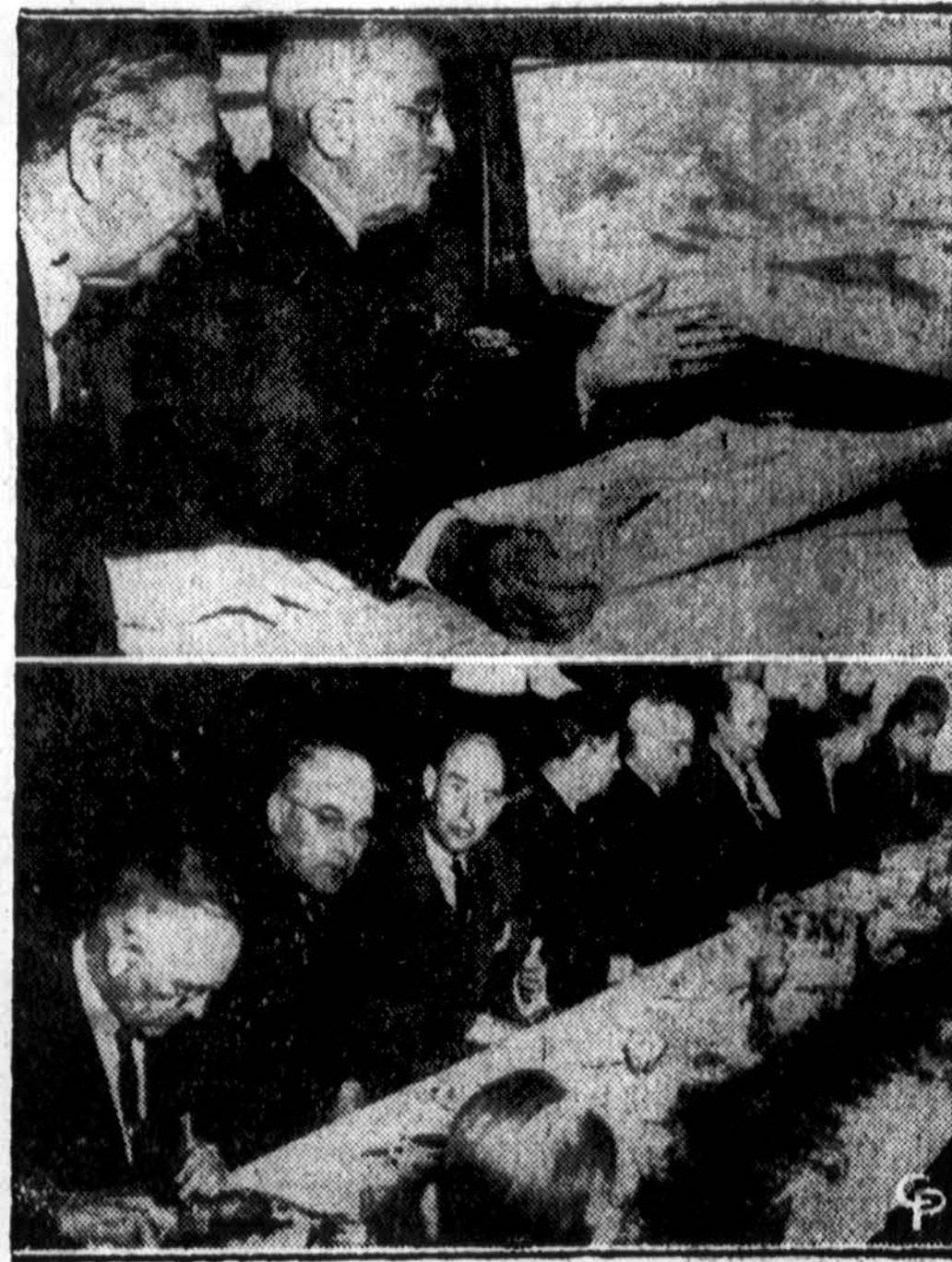
Prezidentas Trumanas su Montanos senatoriumi James B. Murray (viršutinis vaizdas) apžiūri iš lėktuvo vandens apsemtus stovyklus, 25,000 pasmerkti mirti ir apie 50,000 kalėti iki gyvos galvos.