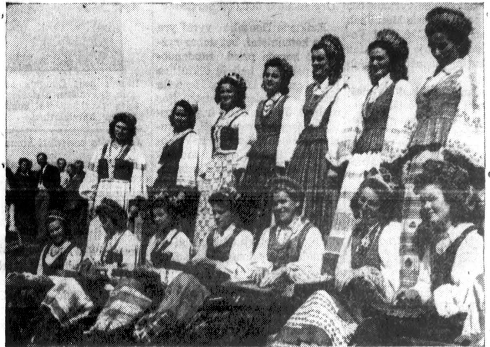
DALIS ČIURLIONIO ANSAMBLIO

Operos Rūmuose — Balandžio 27 Dieną, 3 val. p. p.