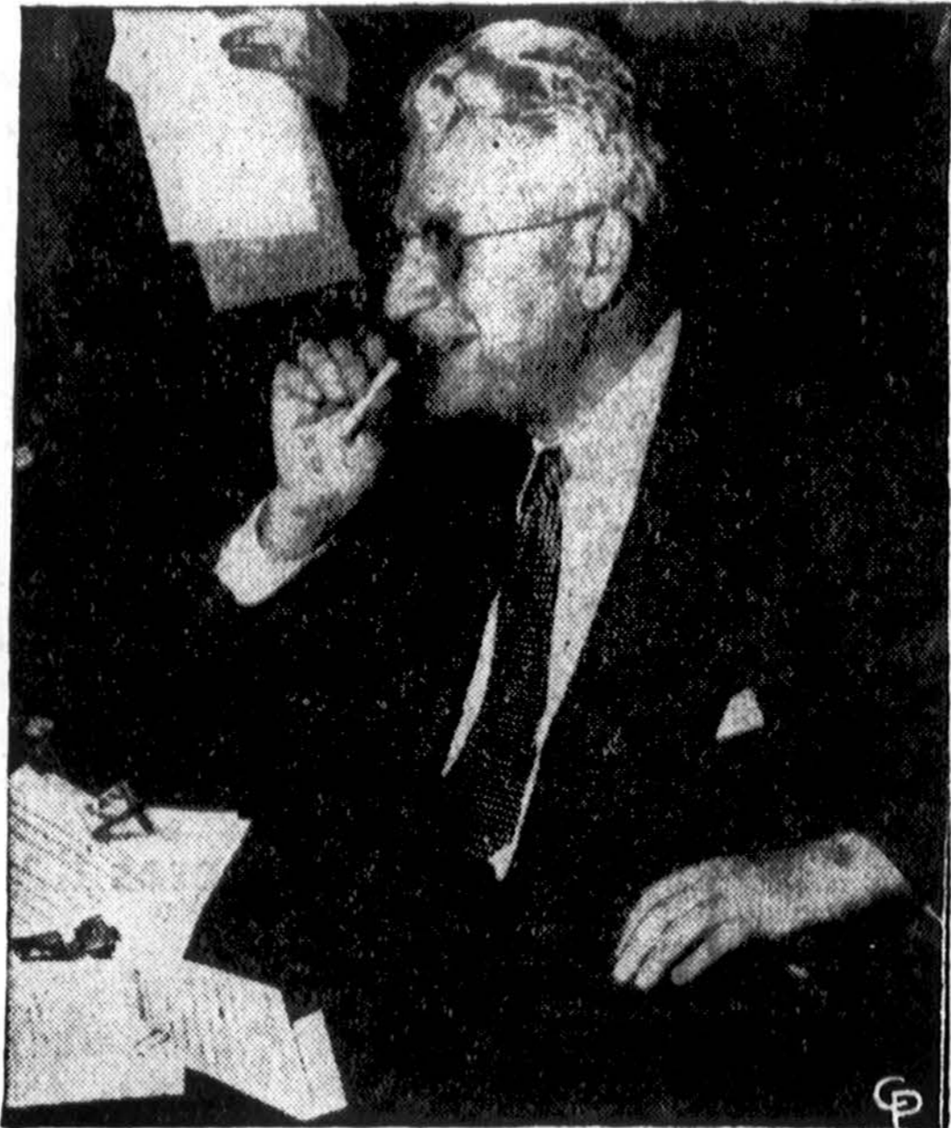
Illinois sen. Douglas praneša spaudos atstovams, kad Illinois gub. Stevenson atsiskaičius priėmė pasiūlymą būti demokratų partijos prezidentiniu kandidatu, jis remiaš Tennessee sen. Ke-fauver kandidatūrą.