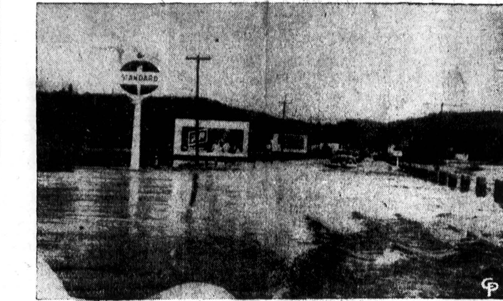
Cia matoma savo vandeniu pro Wisconsin-Iowa tiltą į okeaną plukdant galinga Mississippi upė. Tiltas jungia abi valstijas prie Prairie du Chein, kuris laukia vandens pakilimo iki 21 pėdos. Susisiekimas tiltu sulaukytas.

Norvegijos gyventojai Rusijos artistais mažai domisi, nes komunistų dvideidiskumą gerai pažįsta. Pokarinis susižavėjimas rusais yra visai dingęs. Tai rodo, kad ir šie faktai: Norvegijos kompartijos laikraštis per 4 metus neteko 34,000 prenumeratorių, 1949 m. į parlamentą nebeįrinktas nė vienas komunistas, darbininkų organizacijų vadovybės apsisvalė nuo komunistų.