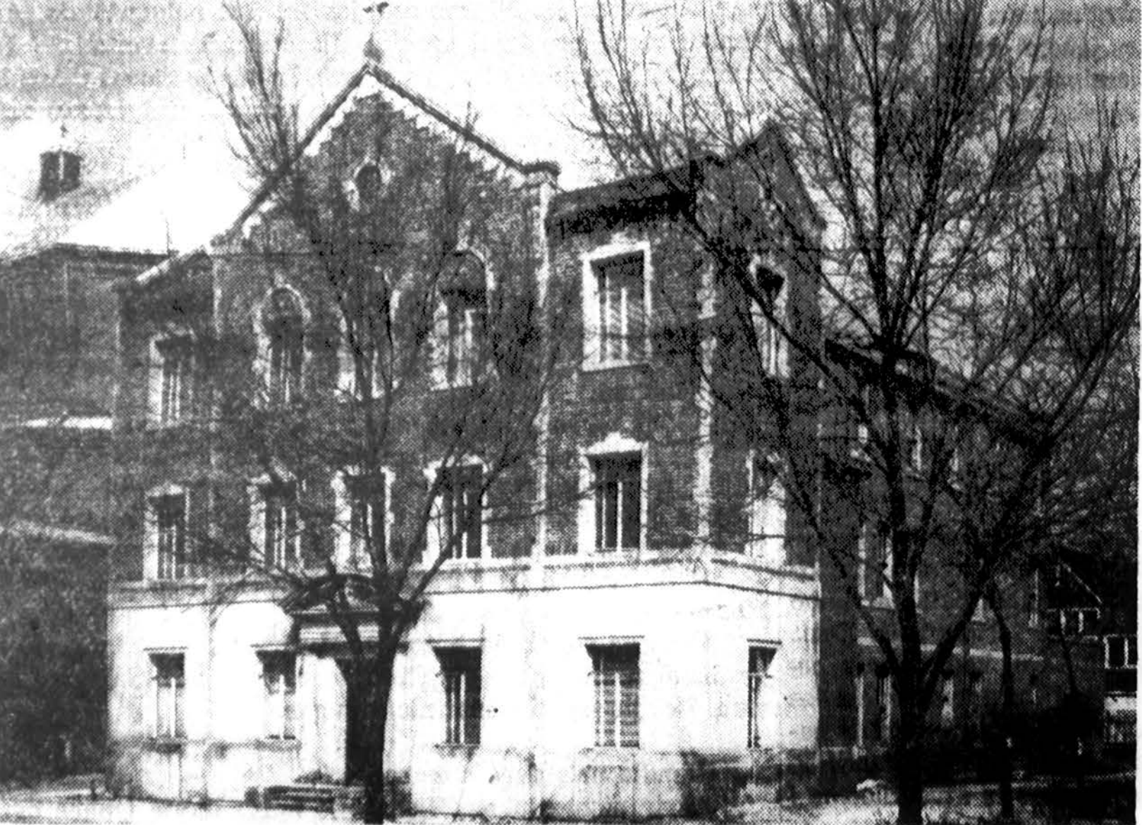
Sv. Antano parapijos naujai atremontuota klebonija