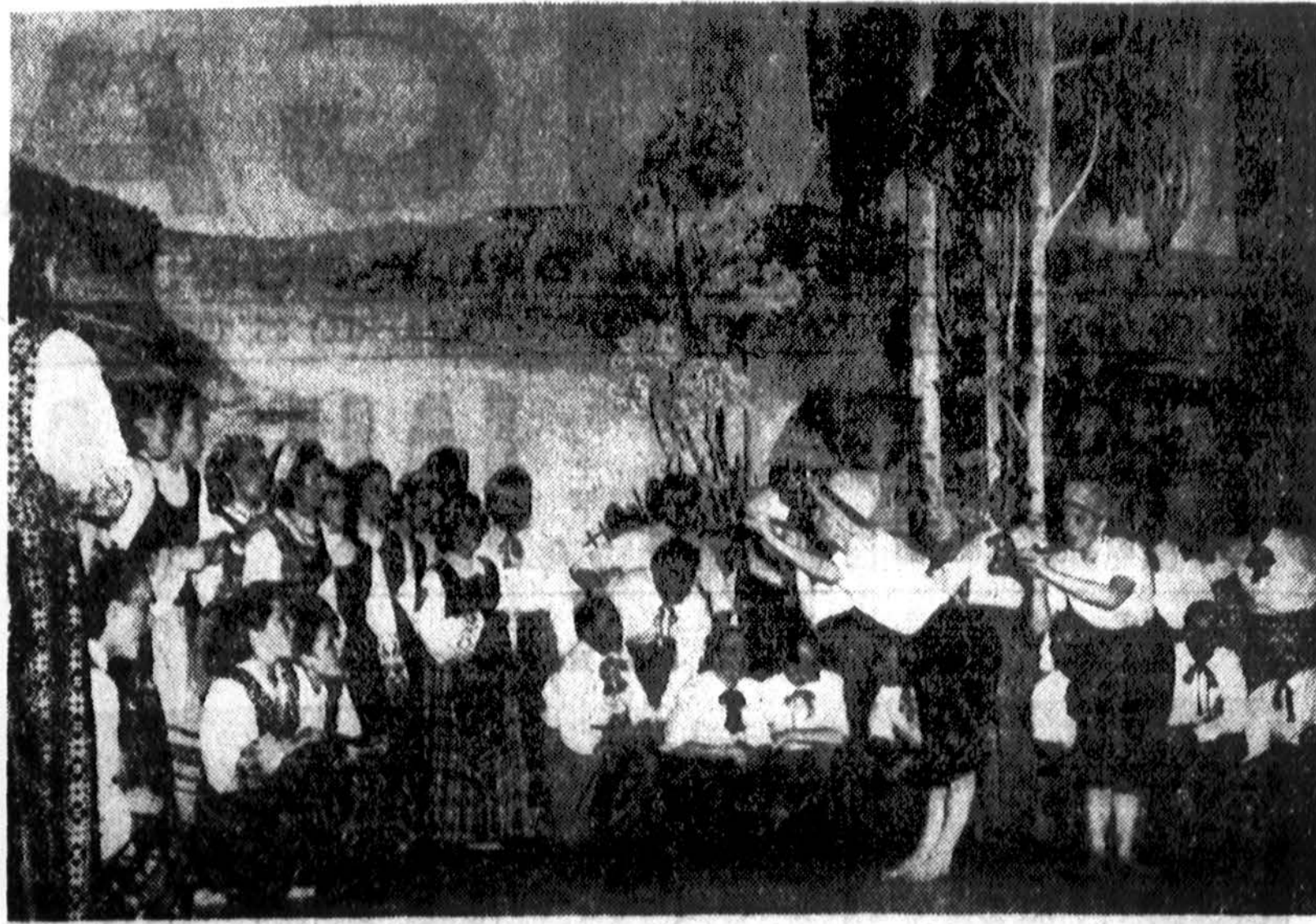
"Dainavos" ansamblis muzikalinio veikalas „Nemunas žydi“ metu, 1951 m. birželio 16 d. Toronte, „Eaton“ auditorijoje.

2146 SO. HOYNE AVE. Tel. Virginia 7-7097