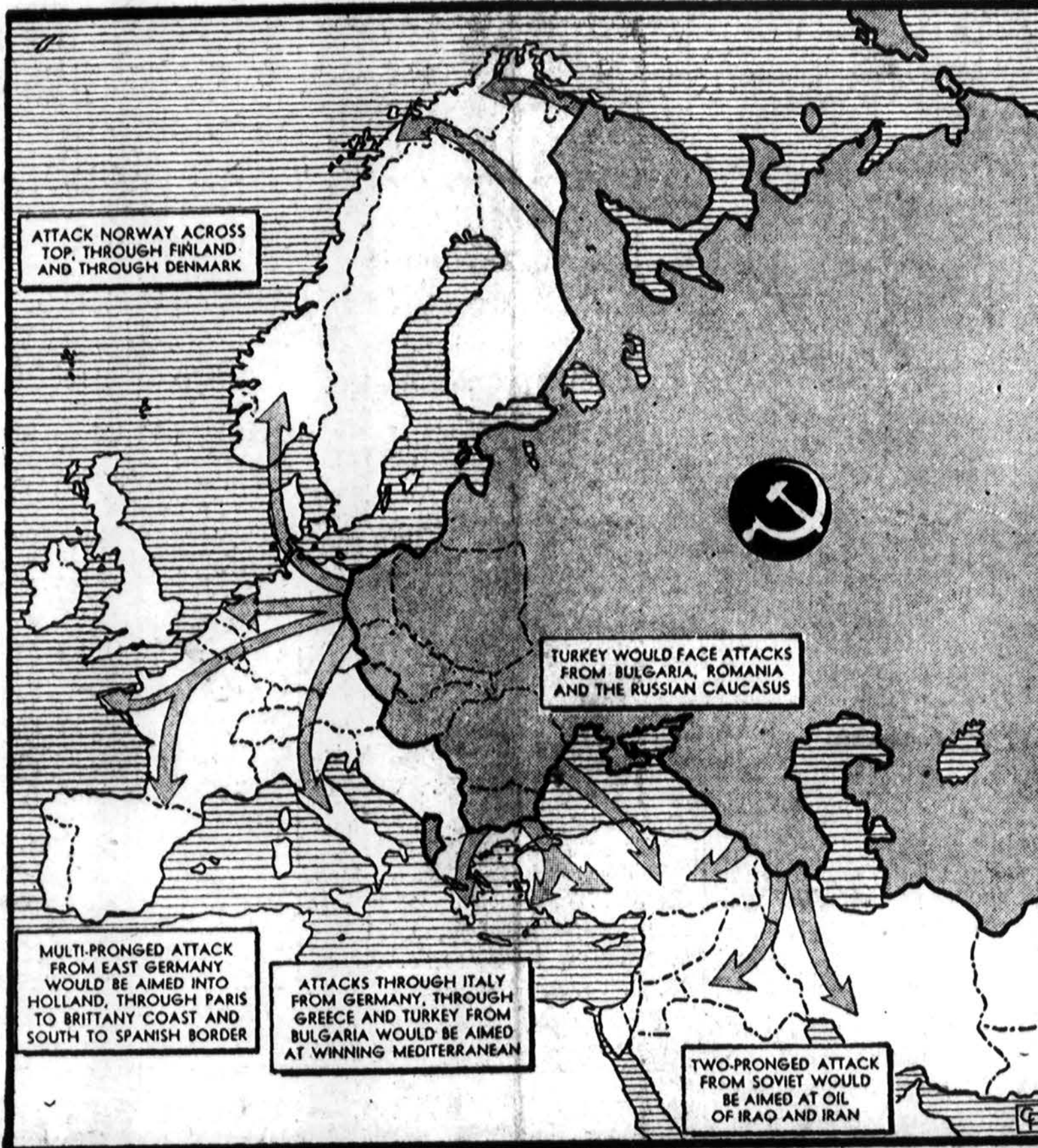
Jei Rusija yra nutarusi pulti Vakarų, tai karo ekspertai mano, jog puolimas vyks čia pavaizduo- tomis kryptimis. Tie patys ekspertai mano, kad Rusija bent šiemet nepuls.