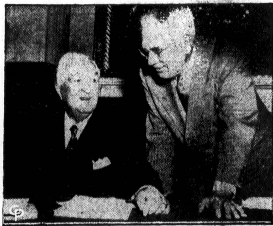
Sen. McCarran, Nevados demokratas (kairėje), praneša, kad jo pirminkaujama senato teisų komisija 8 prieš 4 patarė senatui patvirtinti naujojo Attorney General McGranery paskyrimą. Sen. Ferguson (dešinėje), respublikonas iš Michigan, su kitais trim senatoriais balsavo prieš patvirtinimą, įtelks senatui mažumos raportą ir tuo reikalu pačiame senate pradės diskusijas.