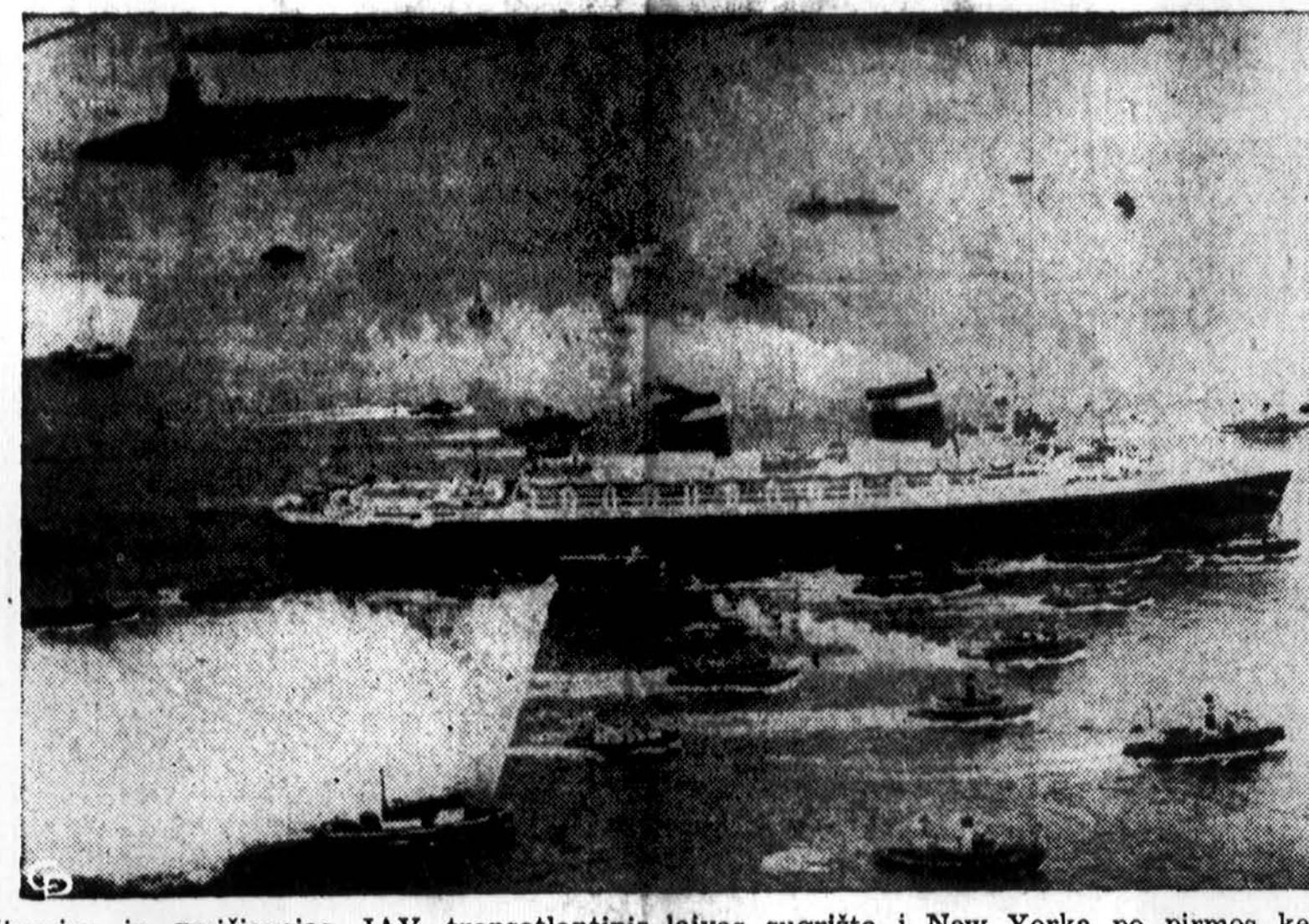
Didžiausias ir greičiausias JAV transatlantinis laivas sugrįžta į New Yorką po pirmos kelionės į Europą. Jo vardas: S. S. United States. Pastatymas kaštavo 73 mil. dol. Sakoma, kad galės plaukti 34 mazgų greičiu ir paimsias „mėlynąjį kaspiną“ iš britų Queen Mary.