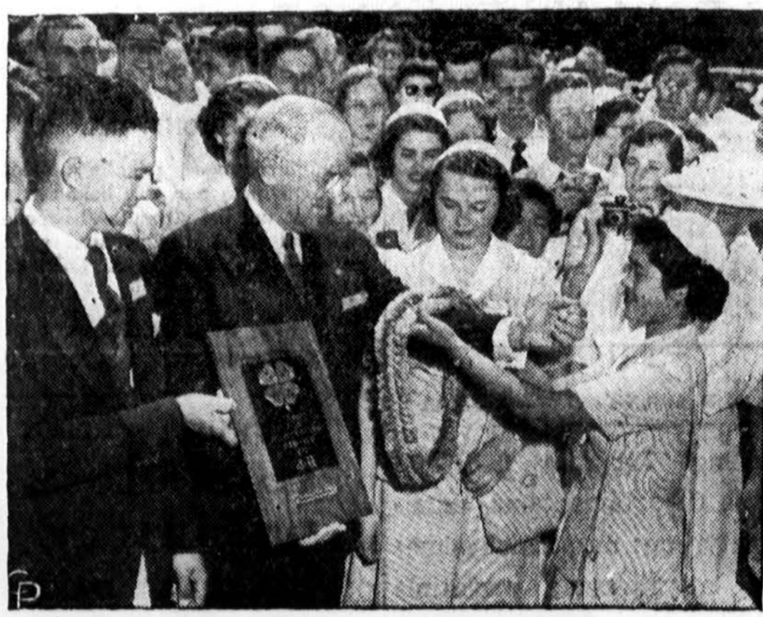
200 berniukų ir mergaičių 44 klubo atstovų Washingtono, savo stovyklos proga, įteikia prezidentui ornamentuotą lentelę ir orchidėjų vainiką iš Havajų.